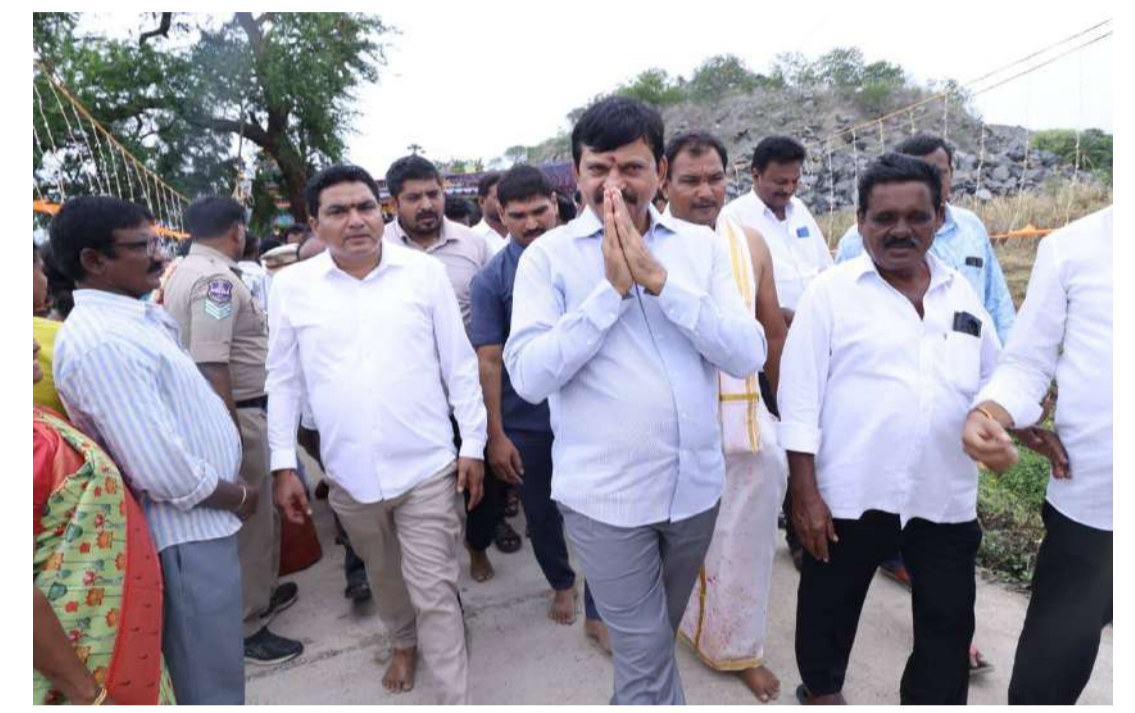
మధ్య ఐక్యతను, సౌభ్రాతృత్వాన్ని పెంపొందిస్తోయ్యారు. ముత్యాలమ్మ అమ్మవారి కృపాకటాక్షాలతో రాష్ట్ర ప్రజలంతా ఆయురారోగ్యాలతో వర్ధిల్లాలని, సకాలంలో సమృద్ధిగా వర్షాలు కురిసి తెలంగాణ పొడిపంటలతో సుఖిష్టంగా ఉండాలని ఆకాంక్షించారు. గ్రామీణ ప్రాంతాల సమగ్ర అభివృద్ధికి ప్రభుత్వం నిరంతరం కట్టుబడి ఉంటుందని స్పష్టం చేశారు.