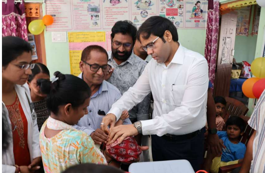
పల్నే పోలియో కేంద్రాన్ని ప్రారంభించిన జిల్లా కలెక్టర్. సీ కే న్యూస్ భద్రాచలం కొత్తగూడెం జిల్లా ప్రతినిధి, జూన్ 28, ఆదివారం జాతీయ పల్నే పోలియో కార్యక్రమం సందర్భంగా