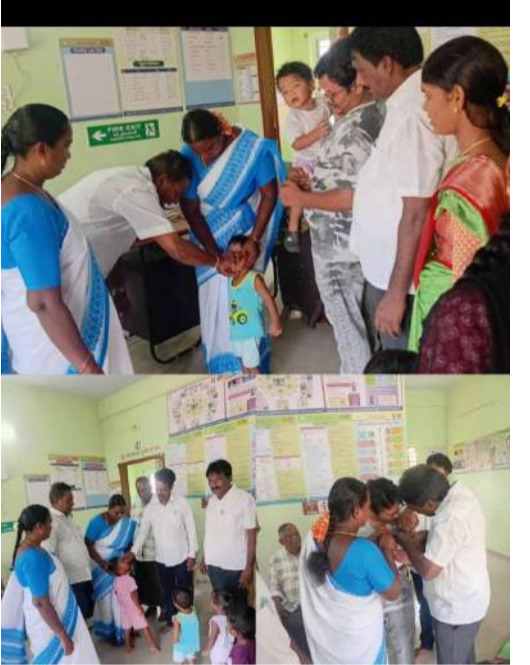
సీ కే న్యూస్ చింతకాని ప్రతినిధి. పల్స్ పోలియో