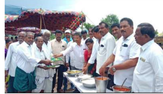
సి కె స్టూన్ చింతకాని ప్రతినిధి. చింతకాని మండలం