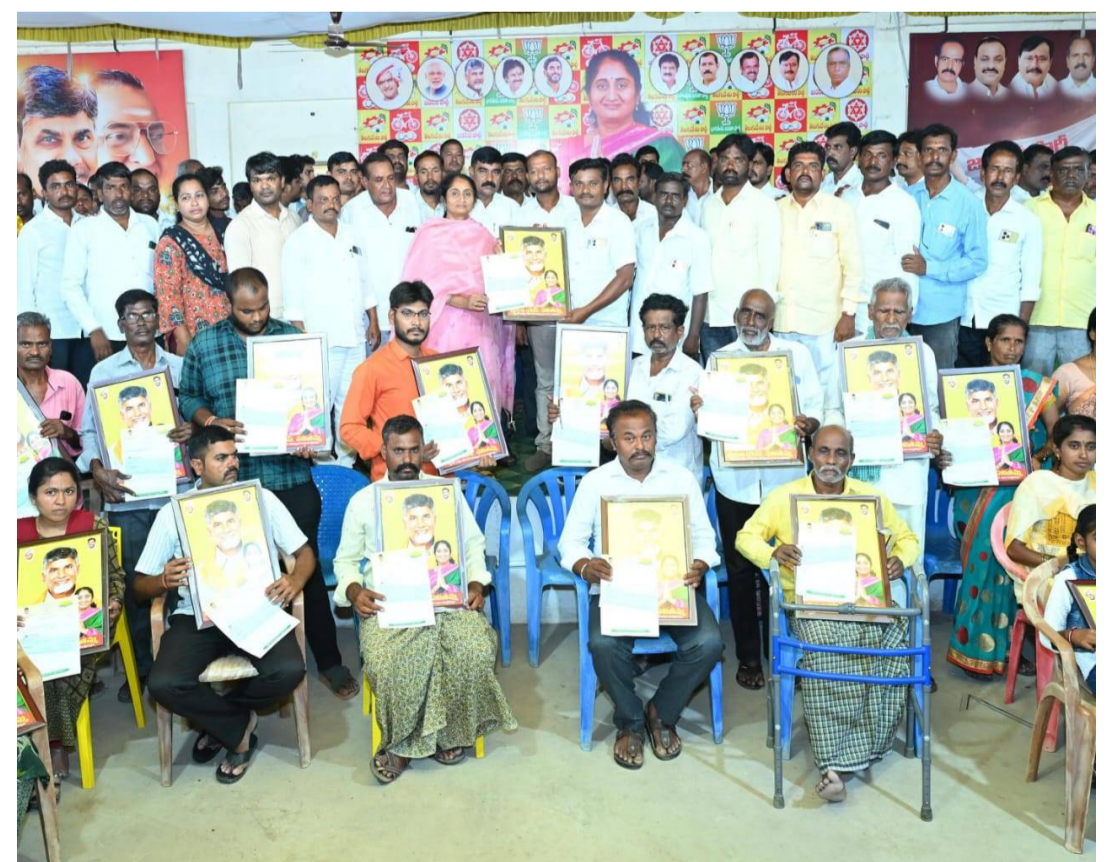
అధికారులు, పార్టీ నాయకులు, కార్యకర్తలు, లబ్ధిదారులు మరియు వారి కుటుంబ సభ్యులు పాల్గొన్నారు.