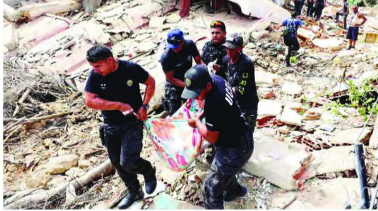
కాలమానం (ప్రకారం) రెండు పవర్ఫుల్ భూకంపాలు పెను విధ్వంసాన్ని సృష్టించాయి. గురువారం తెల్లవారుజామున (భారత భారీగా నష్టాన్ని మిగిల్చాయి. రాజధాని కారకాన్లో సహాయక ప్రాంతాల్లో భవనాలు పేకమేడల్లా కుప్ప కూలిపోవడంతో ప్రజలు శిథిలాల కింద చిక్కుకుపోయారు. ఈ ప్రకృతి విధ్వంసానికి భారీ నష్టం వాటిల్లినట్లు నివేదికలు వెలువడ్డాయి. యూఎస్ జయాలాజిక్లో సర్వే ప్రకారం, గత 100 సంవత్సరాలలో వెనిజులాను తాకిన అత్యంత శక్తివంతమైన భూకంపాల్లో ఇది ఒకటిగా చెబుతోంది. ప్రాథమిక అంచనాల ప్రకారం లక్ష మంది వరకు మరణించి ఉండవచ్చు. భూకంపం తరువాత, యూఎస్ పసిఫిక్ సునామీ హెచ్చరిక కేంద్రం పూర్వో రికో, యూఎస్, బ్రిటిష్ పర్సిన్ దీవులు, అరుబా, కురాకో, బొనైర్ తీరాలకు సునామీ హెచ్చరికను జారీ చేసింది. అయితే, పరిస్థితిని అంచనా వేసిన తరువాత సుమారు గంట తర్వాత ఆ హెచ్చరికను ఉపసంహరించుకున్నారు.