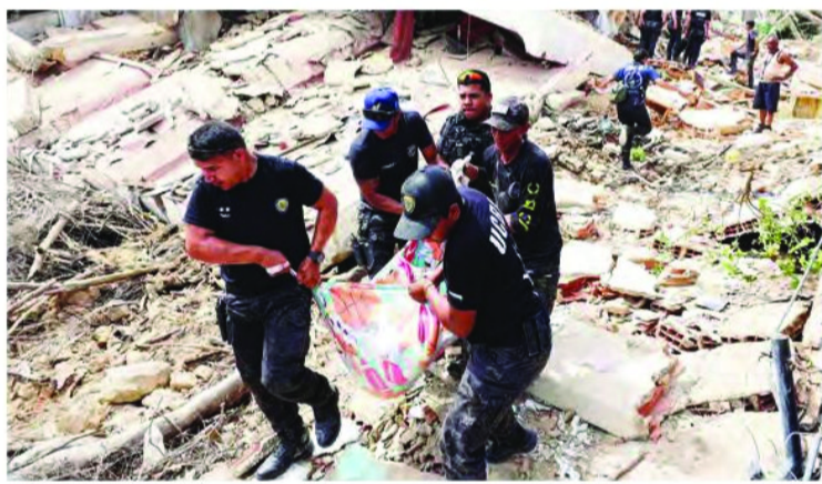
కాలమానం (ప్రకారం) రెండు పవర్ఫుల్ భూకంపాలు పెను విధ్వంసాన్ని సృష్టించాయి. గురువారం తెల్లవారుజామున (భారత భారీగా నష్టాన్ని మిగిల్చాయి. రాజధాని కారకాన్లో సహాయక ప్రాంతాల్లో భవనాలు పేకమేడల్లా కుప్ప కూలిపోవడంతో ప్రజలు శిథిలాల కింద చిక్కుకుపోయారు. ఈ ప్రకృతి విధ్వంసానికి భారీ నష్టం వాటిల్లినట్లు నివేదికలు వెలువడ్డాయి. యూఎస్ జయాలాజిక్లో సర్వే ప్రకారం, గత 100 సంవత్సరాలలో వెనిజులాను తాకిన అత్యంత శక్తివంతమైన భూకంపాల్లో ఇది ఒకటిగా చెబుతోంది. ప్రాథమిక అంచనాల ప్రకారం లక్ష మంది వరకు మరణించి ఉండవచ్చు. భూకంపం తరువాత, యూఎస్ పసిఫిక్ సునామీ హెచ్చరిక కేంద్రం పూర్వో రికో, యూఎస్, బ్రిటిష్ పర్సిన్ దీవులు, అరుబా, కురాకో, బొనైర్ తీరాలకు సునామీ హెచ్చరికను జారీ చేసింది. అయితే, పరిస్థితిని అంచనా వేసిన తరువాత సుమారు గంట తర్వాత ఆ హెచ్చరికను ఉపసంహరించుకున్నారు.