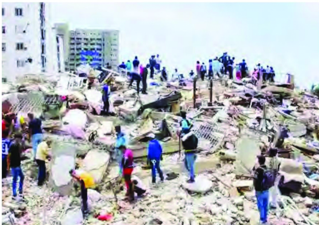
కాలమానం (ప్రకారం) రెండు పవర్ఫుల్ భూకంపాలు పెను విధ్వంసాన్ని సృష్టించాయి. గురువారం తెల్లవారుజామున (భారత భారీగా నష్టాన్ని మిగిల్చాయి. రాజధాని కారకాన్లో సహాయక ప్రాంతాల్లో భవనాలు పేకమేడల్లా కుప్ప కూలిపోవడంతో ప్రజలు శిథిలాల కింద చిక్కుకుపోయారు. ఈ ప్రకృతి విధ్వంసానికి భారీ నష్టం వాటిల్లినట్లు నివేదికలు వెలువడ్డాయి. యూఎస్ జయాలాజిక్లో సర్వే ప్రకారం, గత 100 సంవత్సరాలలో వెనిజులాను తాకిన అత్యంత శక్తివంతమైన భూకంపాల్లో ఇది ఒకటిగా చెబుతోంది. ప్రాథమిక అంచనాల ప్రకారం లక్ష మంది వరకు మరణించి ఉండవచ్చు. భూకంపం తరువాత, యూఎస్ పసిఫిక్ సునామీ హెచ్చరిక కేంద్రం పూర్వో రికో, యూఎస్, బ్రిటిష్ పర్సిన్ దీవులు, అరుబా, కురాకో, బొనైర్ తీరాలకు సునామీ హెచ్చరికను జారీ చేసింది. అయితే, పరిస్థితిని అంచనా వేసిన తరువాత సుమారు గంట తర్వాత ఆ హెచ్చరికను ఉపసంహరించుకున్నారు.

లాటిన్ అమెరికా దేశమైన వెనిజులాలో గురువారం తెల్లవారుజామున (భారత కాలమానం ప్రకారం) రెండు పవర్ఫుల్ భూకంపాలు పెను విధ్వంసాన్ని సృష్టించాయి. భారీగా నష్టాన్ని మిగిల్చాయి. రాజధాని కారకాన్లో సహాయక ప్రాంతాల్లో భవనాలు పేకమేడల్లా కుప్ప కూలిపోవడంతో ప్రజలు శిథిలాల కింద చిక్కుకుపోయారు. ఈ ప్రకృతి విధ్వంసానికి భారీ నష్టం వాటిల్లినట్లు నివేదికలు వెలువడ్డాయి. యూఎస్ జయాలాజిక్లో సర్వే ప్రకారం, గత 100 సంవత్సరాలలో వెనిజులాను తాకిన అత్యంత శక్తివంతమైన భూకంపాల్లో ఇది ఒకటిగా చెబుతోంది. ప్రాథమిక అంచనాల ప్రకారం లక్ష మంది వరకు మరణించి ఉండవచ్చు. భూకంపం తరువాత, యూఎస్ పసిఫిక్ సునామీ హెచ్చరిక కేంద్రం పూర్వో రికో, యూఎస్, బ్రిటిష్ పర్సిన్ దీవులు, అరుబా, కురాకో, బొనైర్ తీరాలకు సునామీ హెచ్చరికను జారీ చేసింది. అయితే, పరిస్థితిని అంచనా వేసిన తరువాత సుమారు గంట తర్వాత ఆ హెచ్చరికను ఉపసంహరించుకున్నారు.