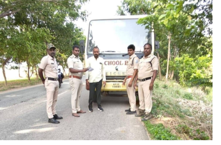
పాటించని స్కూల్ బస్సులపై కఠిన చర్యలు తప్పవు అని రవాణా శాఖ అధికారులు స్పష్టం చేస్తున్నారు.