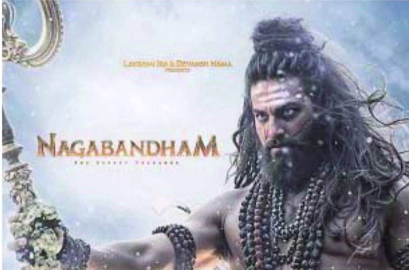
టాలీవుడ్లో తెరకెక్కుతున్న ప్రెస్టీజియస్ మైగ్రేషన్ ఫాంటసీ ట్రిలర్ చిత్రం

'నాగబంధం' ట్రిలర్లో మంచి బజ్ క్రియేట్ చేసింది. భారీ బడ్జెట్తో రూపొందిస్తున్న ఈ