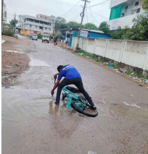
వేసేటప్పుడు మరియు మట్టిని తొలగించి పైన్ వేయగలరని కాలనీవాసులు మరియు వాహనదారులు కోస్తున్నారు.

మిషన్ భగీరథ పైన్ కోసం ప్రధాన రహదారిపై గుంత తవ్వి మరచిన అధికారులు తీవ్ర ఇబ్బందులు ఎదుర్కొంటున్న వాహనదారులు వాహనా దారులు, మరియు ఆటోలు మరియు సైకిల్ పై వెళ్తున్న చిన్న పిల్లల ప్రమాదాలకు కారకులు ఎవరు? సి కె స్యూస్ ప్రతినిధి గద్వాల పట్టణం:- గద్వాల పట్టణ కేంద్రంలోని 16వ వార్డు ఉన్న నవరంగ్ టాకెట్ వెళ్లే ప్రధాన రహదారిపై మిషన్ భగీరథ పైన్ వేయడం కోసం రోడ్డును తవ్వుతారు. కానీ పైన్ లైన్ వేయలేదు గుంత తవ్వుతారు. ఆ రోడ్డుపై ఆ గుంత ఉండటంతో వాహనదారులు భయభ్రాంతులకు గురై కింద పడిపోతున్నారు. సైకిల్ లపై వెళ్తున్న విద్యార్థులు కూడా కింద పడడం జరుగుతున్నది. కావున 16వ వార్డ్ కౌన్సిలర్ స్పందించి.. వచ్చిపోయే వాహనదారులకు ఎలాంటి ప్రమాదాలు జరగకుండా ముందస్తు చర్యలుగా మిషన్ భగీరథ పైన్ వేసి త్వరగా రోడ్డును పూర్తిగా మట్టి వేసి కచ్చి పైన్ వేసి త్వరగా రోడ్డుని పూర్తిగా మట్టి వేసి కచ్చి పైన్ వేసేటప్పుడు మరియు మట్టిని తొలగించి పైన్ వేయగలరని కాలనీవాసులు మరియు వాహనదారులు కోస్తున్నారు.