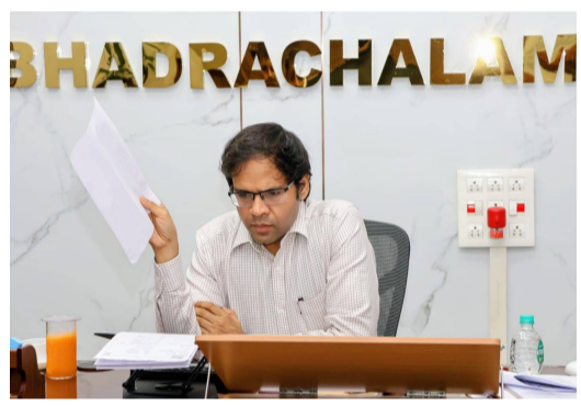
బడుతుందని, ప్రజలు ఈ అవకాశాన్ని వినియోగించుకోవాలని జిల్లా కలెక్టర్ కోరారు.