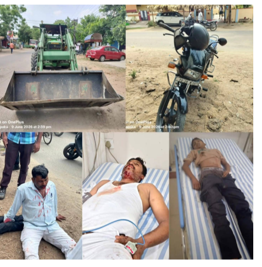
సి కే స్యూస్ భద్రాద్రి కొత్తగూడెం జిల్లా ప్రతినిధి, జూన్ 09,