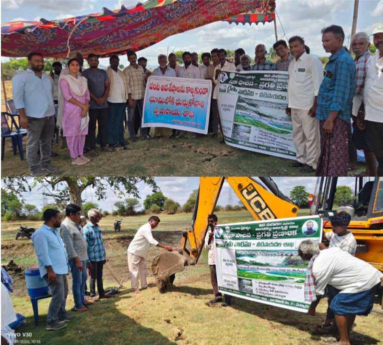
వ్యవసాయాన్ని మరింత లాభదాయకంగా మార్చుకోవాలని కోరారు.

వెల్లడించారు. రైతులు అధునిక పద్ధతులతో పాటు ప్రకృతి అనుకూల వ్యవసాయ విధానాలను కూడా అనుసరించాలని సూచించారు. అదేవిధంగా మొక్కజొన్న, మిర్చి, పత్తి వంటి పంటల అవశేషాలను పొలాల్లో తగలబెట్టడం వల్ల కలిగే అసర్దాలను రైతులకు వివరించారు. పంట అవశేషాలను కాల్చడం వలన భూమిలో ఉండే సూక్ష్మ జీవులు సశీలంగా భూసాయం తగ్గిపోతుందని తెలిపారు. అంతేకాకుండా వాయు కాలుష్యం పెరగడంతో పాటు పర్యావరణానికి కూడా తీవ్ర నష్టం కలుగుతుందని చెప్పారు. పంట అవశేషాలను సేంద్రియ ఎరువుల తయారీలో వినియోగించడం ద్వారా భూమి ఆరోగ్యం మెరుగుపడుతుందని రైతులకు సూచించారు. వారం రోజులపాటు నిర్వహించిన ప్రజాపాలన ప్రగతి ప్రణాళిక రైతు వారోత్సవం ద్వారా రైతులకు పలు వ్యవసాయ అంశాలపై అవగాహన కల్పించినట్లు అధికారులు తెలిపారు. రైతులు ప్రభుత్వ పథకాలను సద్వినియోగం చేసుకొని