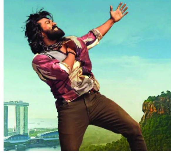
కమర్షియల్ సినిమా అందరికీ కనెక్ట్ అవుతుందని దర్శకుడు ధీమా వ్యక్తం చేస్తున్నారు. పెద్దిని మన హృదయాల్లోంచి తీసేయడం అంత తేలిక కాదని బుచ్చిబాబు తాజాగా చెప్పారు.

రామ్ చరణ్ 'పెద్ది'పై భారీ అంచనాలు ఉన్న విషయం తెలిసిందే. బుచ్చిబాబు దర్శకత్వంలో రానున్న ఈ స్పాన్సర్ డ్రామా కోసం అభిమానులు ఆసక్తిగా ఎదురుచూస్తున్నారు. జూన్ 4న విడుదల కానున్న సినిమా ఒకరోజు ముందుగానే విదేశాల్లో సందడి చేయనుంది. తాజాగా అక్కడ ప్రీసెల్ బుకింగ్స్ ఓపెన్ చేయగా టీకెట్స్ హాట్ కేకుల్లా అమ్ముడయ్యాయి. 24 గంటలకూడా కాకముందే లక్ష టికెట్స్ సేల్ అయ్యాయి. దీంతో నార్త్ అమెరికాలో అత్యంత వేగంగా ఇన్ని టికెట్స్ అమ్ముడైన తొలి సినిమాగా 'పెద్ది' రికార్డు నెలకొల్పింది. ట్రైలర్ కూడా విడుదల కాకముందే ఈ స్ట్రాయిల్ టికెట్స్ సేల్ కావడంతో అభిమానులు సంబరపడుతున్నారు. సినిమా విడుదలకు ఇంకా చాలా రోజులు ఉండడంతో అప్పటివరకూ మరిన్ని రికార్డులు సొంతం చేసుకోవడం ఖాయమని భావిస్తున్నారు. మరోవైపు 'పెద్ది' పోస్ట్ ప్రొడక్షన్ పనులన్నీ పూర్తయ్యాయి. తాజాగా ఎడిటింగ్ కూడా పూర్తయిందని దర్శకుడు తెలిపారు. త్వరలోనే ట్రైలర్ ను విడుదల చేసే అవకాశం ఉంది. ట్రైలర్ విడుదలైన అనంతరం టికెట్స్ భారీగా సేల్ అవ్వచ్చని సినీవర్గాల సమాచారం. ఎమోషన్ ప్రధానంగా తెరకెక్కిన