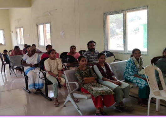
సంబంధిత ఆరోగ్య శాఖ అధికారులు, సిబ్బంది పాల్గొన్నారు.