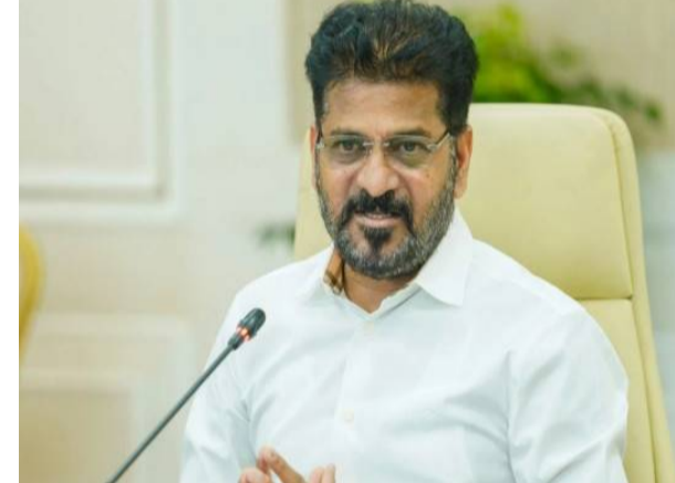
తెలంగాణ ప్రభుత్వం కీలక నిర్ణయం తీసుకుంది. శ్రీ వాసవీ మాత జయంతిని రాష్ట్ర పండుగగా అధికారికంగా ప్రకటించింది. ఇకపై ప్రతి