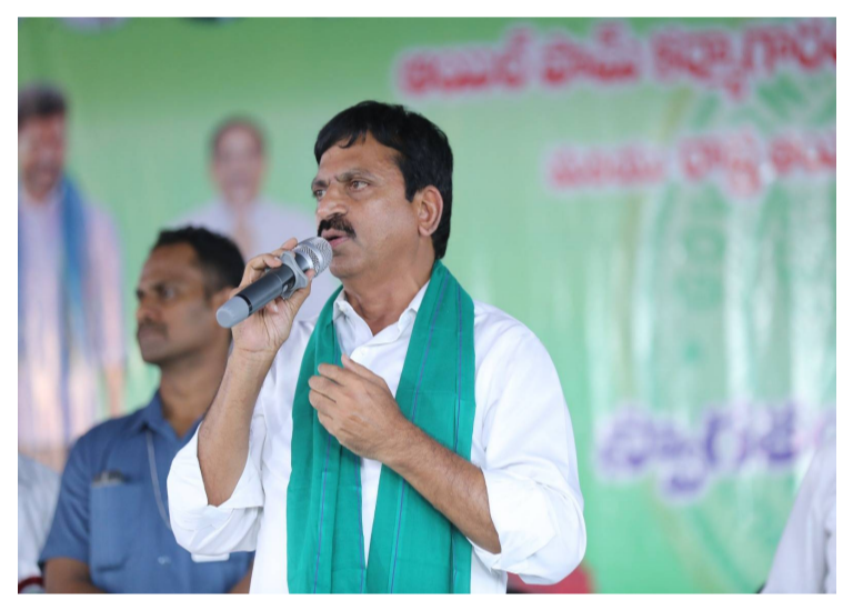
ప్రతి విద్యార్థి ఉన్నత స్థాయికి చేరాలి సకల సదుపాయాలు కల్పిస్తాం.