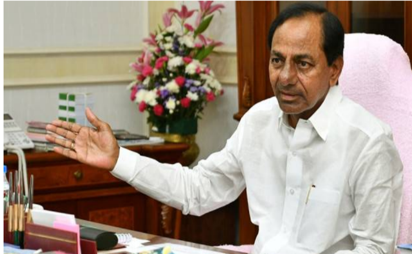
కేసీఆర్ దిశానిర్దేశం చేయనున్నారు. ముఖ్యంగా రజతోత్సవ వేడుకల ముగింపు సందర్భంగా ఒక భారీ యాక్షన్ ప్లాన్ ను ప్రకటించే అవకాశం ఉంది.

బీఆర్ఎస్ పార్టీ రజతోత్సవాల సందర్భంగా, పార్టీ అధినేత కేసీఆర్ కీలక నిర్ణయం తీసుకున్నారు. ఈ నెల 27వ తేదీన మధ్యాహ్నం 2 గంటలకు హైదరాబాద్ లోని తెలంగాణ భవన్ లో అత్యున్నత స్థాయి సమావేశాన్ని ఏర్పాటు చేశారు. పార్టీ సంస్థాగత బలోపేతమే లక్ష్యంగా ఈ భేటీ జరగనుంది. పార్టీ సభ్యత్వాల పునరుద్ధరణ కార్యక్రమంపై కేసీఆర్ ఈ సమావేశంలో ప్రధానంగా చర్చించనున్నారు. గ్రామ స్థాయి నుంచి రాష్ట్ర స్థాయి వరకు పార్టీని రీ-ఆర్గనైజ్ చేసే దిశగా ఆయన ఈ నిర్ణయం తీసుకున్నారు. ఈ సమావేశానికి పార్టీ ఎంపీలు, ఎమ్మెల్యేలు, మాజీ ఎంపీలు, మాజీ ఎమ్మెల్యేలు, కార్పొరేషన్ మాజీ చైర్మన్లు, జెడ్పీ మాజీ చైర్మన్లు ఆహ్వానించారు. రాష్ట్రంలో మారుతున్న రాజకీయ పరిణామాల నేపథ్యంలో, భవిష్యత్ పోరాటాల కోసం శ్రేణులకు