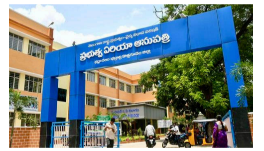
భద్రాచలం ఏరియా ఆసుపత్రిలో వైద్య పీజీ కోర్సులకు రాష్ట్ర ప్రభుత్వ కసరత్తు.