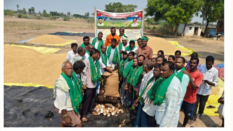
vivo V60 23mm f/1.88 1/3500s ISO50 04/19/2026, 12:11