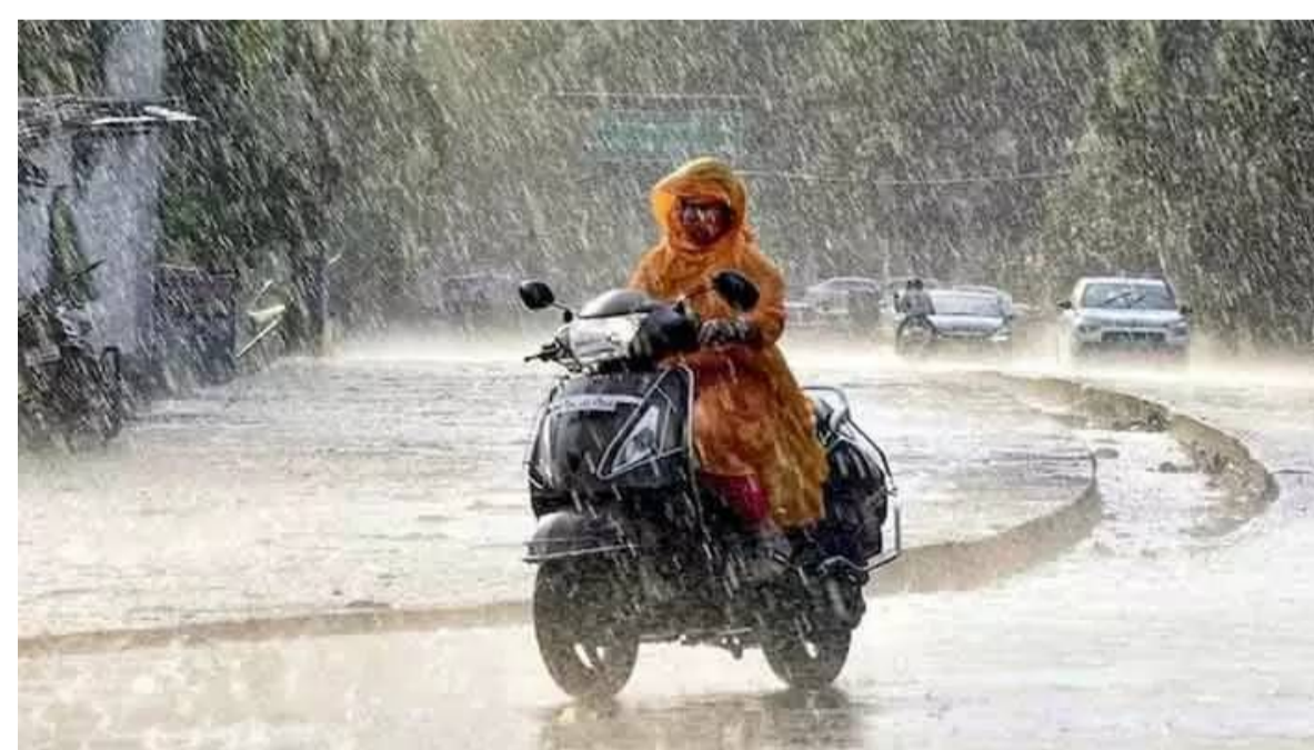
హైదరాబాద్ ఎండవేడితో ఉక్కిరిబిక్కిరి అవుతున్న తెలంగాణ ప్రజలకు వరుణుడు ఉపశమనం కలిగించారు. అదివారం

సాయంత్రం రాష్ట్రంలోని పలు జిల్లాల్లో ఆకస్మికంగా వర్షం కురిసింది. కొన్నిచోట్ల ఈదురు గాలులతో కూడిన భారీ వర్షం