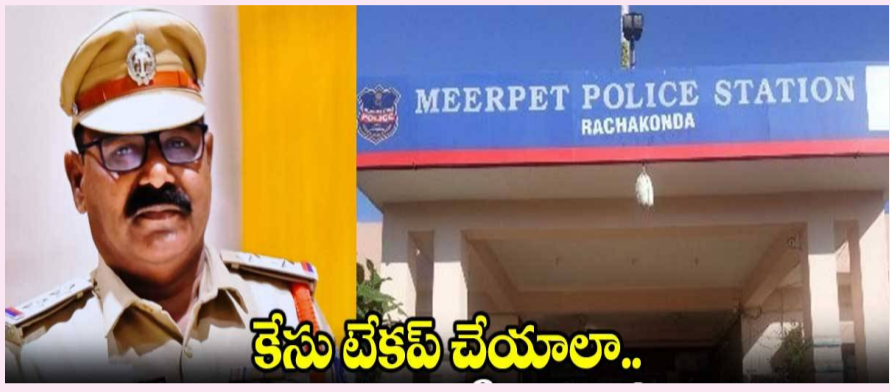
కేసు టేకప్ చేయాలా..