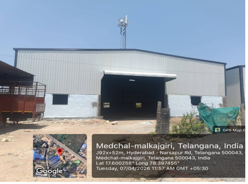
అక్రమ షెడ్ నిర్మాణదారులకు అండగా!.....: దుండిగల్ సర్కిల్ పరిధిలోని గాగిల్లాపూర్ ప్రధాన రహదారిలో ఇండియన్ పెట్రోల్ బంక్ దగ్గర ఎలాంటి

దుండిగల్ సర్కిల్ లో అక్రమార్కులు ఎవరు?: గాగిల్లాపూర్ లో అనుమతి లేకుండా భారీ షెడ్ నిర్మాణం! చోద్యం చూస్తున్న టౌన్ ప్లానింగ్ అధికారులు!: