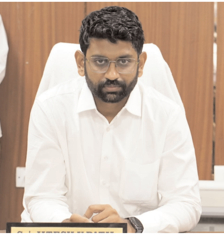
రాయలసీమ తద్వారా నూరు శాతం ఫలితాలు సాధించి రాష్ట్రంలో ఉత్తీర్ణత శాతంలో జిల్లాను అగ్రస్థానంలో నిలపాలని కలెక్టర్ ఆకాంక్షించారు.

విద్యుగరు రూట్ అధికారులు. 73 మంది డిపార్టుమెంట్ అధికారులు, 26 మంది సెంటర్ కన్వోడియన్లు, 73 మంది సిస్టింగ్ స్టాఫ్లను ఏర్పాటు చేశారు.