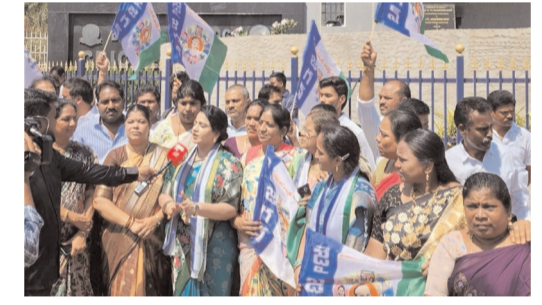
అధ్యక్షులు, వార్డు అధ్యక్షులు, మహిళా నాయకులు, కార్యకర్తలు, ఇతర ప్రజా ప్రతినిధులు తదితరులు పాల్గొన్నారు.

సీ కే న్యూస్ విశాఖపట్నం ప్రతినిధి ( రవికుమార్ ) మార్చి 20 : విశాఖపట్నం మధురవాడ క్రికెట్ స్టేడియం దగ్గర నిరసన కార్యక్రమం జరిగింది. విశాఖ ప్రగతికి రాజశేఖరులు వేసిన వైయస్ఆర్ ను కూటమి సర్కారు తీవ్రంగా అవమానించింది.