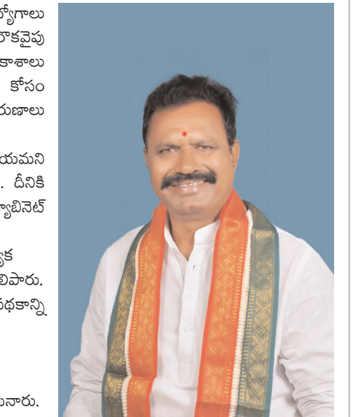
ఒకవైపు ఉద్యోగాలు కల్పిస్తూనే మరొకవైపు ఉపాధి అవకాశాలు పెంపొందించడం కోసం సబ్సిడీతో రుణాలు అందించడం హార్షించడం విషయమని ఆయన తెలిపారు. దీనికి సహకరించిన క్యాబినెట్ మంత్రులకు, ఎమ్మెల్యేలకు,ప్రత్యేక ధన్యవాదాలు తెలిపారు. ఈ పథకాన్ని నిరుద్యోగులు సద్వినియోగం చేసుకోవాలని మీడియాతో తెలిపినారు.

సీ కే న్యూస్ పలిగొండ మండలం ప్రతినిధి బాలరాజు మార్చి 27. యాదాద్రి భువనగిరి జిల్లా పలిగొండ మండల కేంద్రంలోని మీడియాతో మాట్లాడుతూ. కాంగ్రెస్ ప్రభుత్వం ముఖ్యమంత్రి శ్రీ రేవంత్ రెడ్డి తీసుకువచ్చిన రాజీవ్ యువ వికాసం పథకం పేరుతో 6 వేల కోట్లతో తెలంగాణ రాష్ట్రంలోని ఐదు లక్షల మంది నిరుద్యోగులకు ఉపాధి అవకాశాలు కల్పిస్తున్న రాష్ట్ర ముఖ్యమంత్రి రేవంత్ రెడ్డి గారికి భువనగిరి శాసన సభ్యులు శ్రీ కుంభం అనిల్ కుమార్ రెడ్డి కి ప్రత్యేక ధన్యవాదాలు,కృతజ్ఞతలు తెలిపారు.గత పది సంవత్సరాలాగా తీవ్ర అన్యాయానికి గురైన నిరుద్యోగులకు కాంగ్రెస్ పార్టీ ఈ ప్రభుత్వం