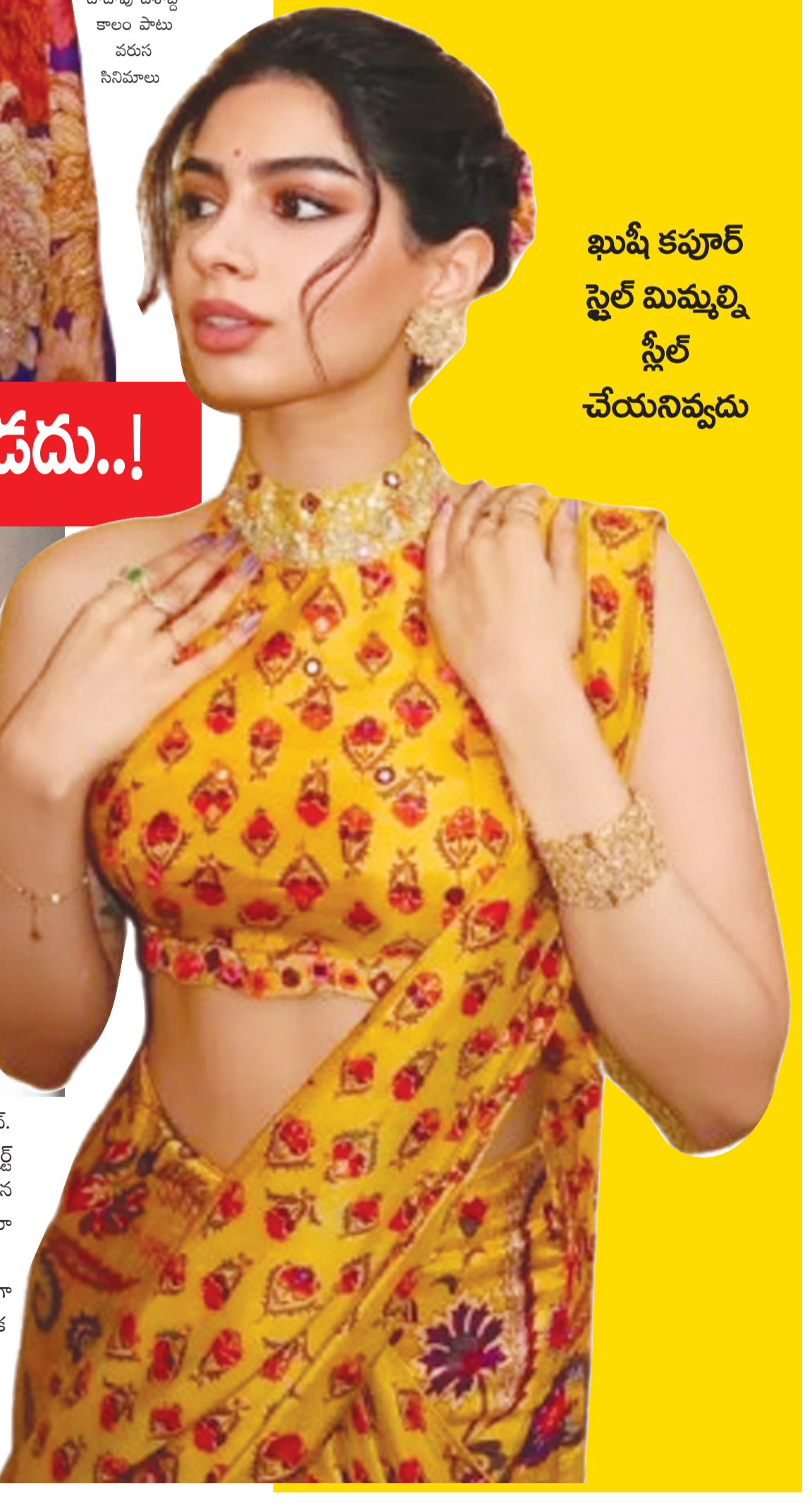
ఖుషీ కపూర్ స్టైల్ మిమ్మల్ని స్ట్రీట్ చేయనివ్వదు

యానిమల్ సినిమాతో పాస్ ఇండియా హిట్ అందుకున్నాడు బాలీవుడ్ స్టార్ రణ్ బీర్ కపూర్ అంతకుముందు కూడా రణ్ బీర్ హిట్ సినిమాలు చేసినా యానిమల్ సినిమా ఇంపాక్ట్ రాలేదని చెప్పొచ్చు. సందీప్ వంగ రాసుకున్న కథకు రణ్ బీర్ కపూర్ జస్ట్ జీవించేశాడు అంతే.. అందుకే ఆ సినిమా బాలీవుడ్ బాక్సాఫీస్ ని షేక్ చేసింది. యానిమల్ తర్వాత యానిమల్ పార్ట్ అంటూ మరో సినిమా కూడా ఉంటుందని టాక్. రణ్ బీర్ కపూర్ ప్రస్తుతం రామాయణ్ సినిమా చేస్తున్నారు. ఆ సినిమాతో పాటు మరో రెండు సినిమాలు లైన్ లో ఉన్నాయి.ఇదిలా ఉంటే బాలీవుడ్ క్రేజీ డైరెక్టర్ పూరి జగన్నాథ్ రణ్ బీర్ తో సినిమా ప్రయత్నాలు చేస్తున్నాడని టాక్. రణ్ బీర్ తో పూరి సినిమానూ ఇది జరిగే ఛాన్స్ ఉందా అని అనుకోవచ్చు. బాలీవుడ్ లో