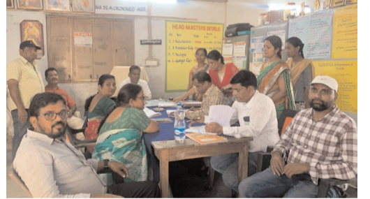
వారికి వివరాలు తెలిపారు