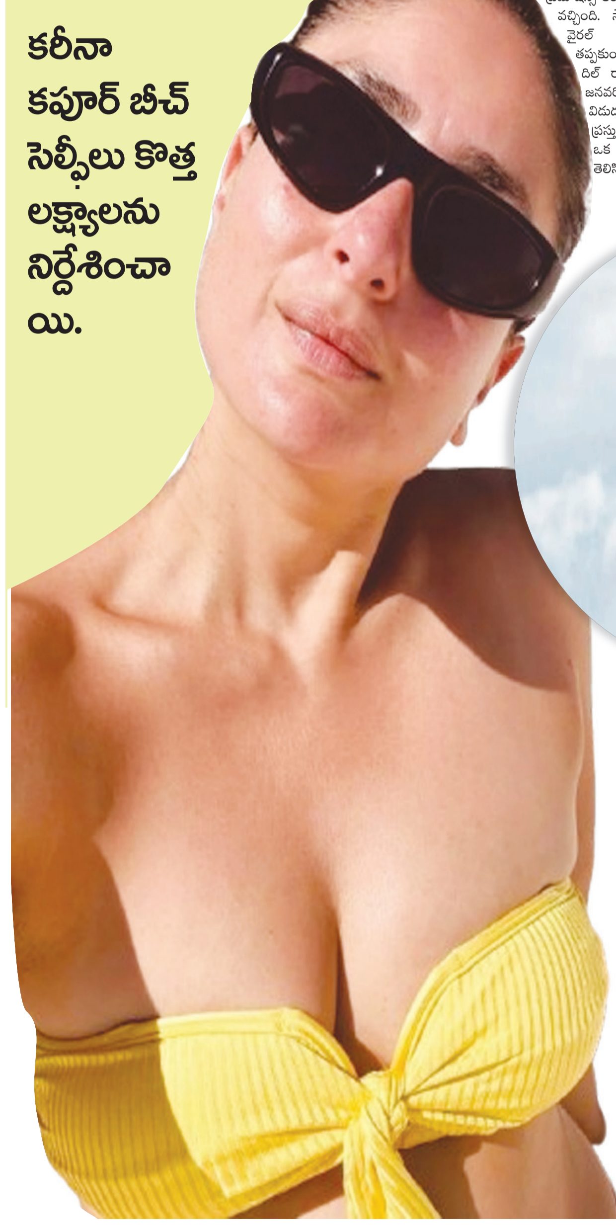
కలీనా కపూర్ బీచ్ సెల్ఫీలు కొత్త లక్ష్యాలను నిర్దేశించాయి.