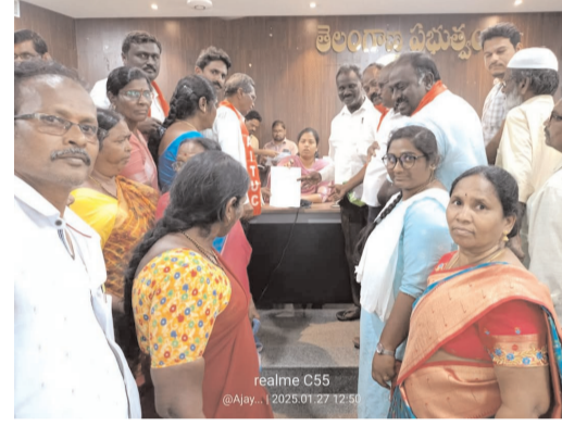
జిల్లా కలెక్టర్ కార్యాలయం వద్ద ధర్మా నిర్వహించిన మధ్యాహ్నం భోజన పథకం కార్యక్రమం.