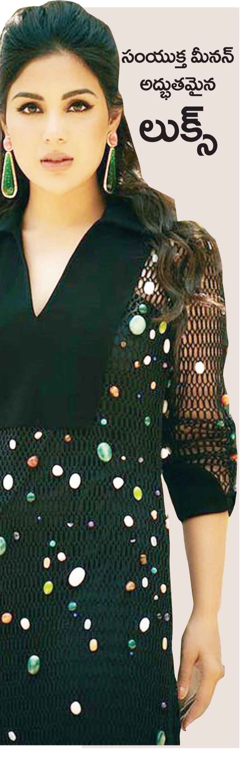
సంయుక్త మీనన్ అద్భుతమైన లుక్స్