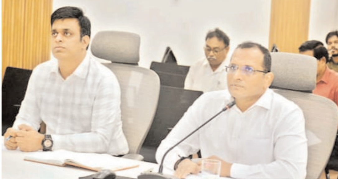
సిబ్బందిని అందుబాటులో ఉంచుతామని, ప్రజల నుంచి వచ్చే వివరాలను స్వీకరించి ఆన్లైన్ చేస్తామని వివరించారు. గ్రామీణ పరిధిలో గ్రామల వారిగా, పట్టణ పరిధిలో వార్డుల వారిగా రెవెన్యూ సదస్సులను నిర్వహించేందుకు చర్యలు తీసుకున్నామని వెల్లడించారు. కలెక్టరేట్ వీసీ హామీ నుంచి జిల్లా రెవెన్యూ అధికారి బీహెచ్ భవానీ శంకర్, కలెక్టరేట్ ఎవ్ ఈశ్వరరావు, డి. సెక్టర్ సూపరింటెండెంట్ గణపతి ఇతర అధికారులు పాల్గొన్నారు.

సి 3 స్టూన్స్ విశాఖపట్నం ప్రతినది ( రవికృష్ణ ) డిసెంబర్ 04 : జిల్లాలో రెవెన్యూ సదస్సుల నిర్వహణకు పక్కా ఏర్పాట్లు చేశామని, సంబంధిత అధికార బృందాలను నియమించామని జిల్లా కలెక్టర్ ఎం.ఎన్. హరేంద్ర ప్రసాద్ పేర్కొన్నారు. ఈ నెల 06వ తేదీ నుంచి జిల్లా వ్యాప్తంగా 156 గ్రామాల్లో సదస్సులను నిర్వహించేందుకు ప్రణాళిక తయారు చేసుకున్నామని తెలిపారు. రాష్ట్ర రెవెన్యూ మంత్రి అనగాని సత్యప్రసాద్, ప్రభుత్వ ప్రత్యేక ప్రధాన కార్యదర్శి (రెవెన్యూ) ఆర్.పి.సి.సి.డి.యూ బుధవారం విజయవాడ నుంచి నిర్వహించిన వీడియో కాన్ఫరెన్స్ పాల్గొన్న కలెక్టర్ ఈ మేరకు జిల్లాలో చేపట్టబోయే చర్యలను వివరించారు. ప్రతి మండలానికి ఒక్కో ప్రత్యేక అధికారిని నియమిస్తున్నామని, వివిధ విభాగాల అధికారులు, సిబ్బందితో కలిపి బృందాలను ఏర్పాటు చేస్తున్నామని చెప్పారు. 11 మండలాల పరిధిలో గుర్తించిన గ్రామాల్లో రెవెన్యూ సదస్సులు ఏర్పాటుపై ఇప్పటికే క్షేత్ర స్థాయి అధికారులకు శిక్షణ అందజేశామని, అవగాహన కల్పించామని పేర్కొన్నారు. సదస్సు జరిగే చోటనే సాంకేతిక