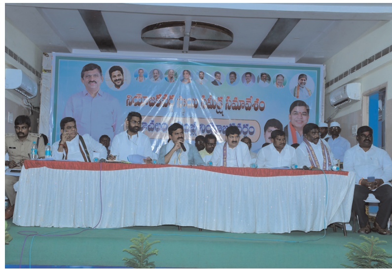
అనంతరం అధికారులతో లిఫ్టా మిటింగ్ లో పాల్గొన్న మంత్రి పాంగులేటి.