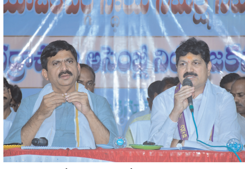
శాఖ మత్తులు పొంగులేటి

అనంతరం అధికారులతో లిఫ్టా మిటింగ్ లో పాల్గొన్న మంత్రి పాంగులేటి. శ్రీనివాస్ రెడ్డి అన్నారు. శనివారం భద్రాచలంలోని ఏఎస్ కాలనీలో నిర్మాణం పూర్తయిన ఖాళీగా ఉన్న ఇందిరమ్మ డబుల్ బెడ్ రూమ్ ఇండ్లను ఆయన పరిశీలించారు. 250 ఇండ్లు పూర్తి అయిన చిన్న చిన్న మరమ్మతుల కారణంగా ఖాళీగా ఉంచడంతో అవి పాడైపోవడానికి ఆస్కారం ఉంటుందని 12 కోట్ల 62 లక్షలతో నిర్మాణం చేపట్టిన ఇండ్ల తప్పని సరిగా పేద వార్తని గిరిజన లబ్ధిదారుల ను గుర్తించి అందించడానికి ప్రణాళికలు సిద్ధం చేయాలని సంబంధిత అధికారులకు ఆదేశించారు. ఏజెన్సీ