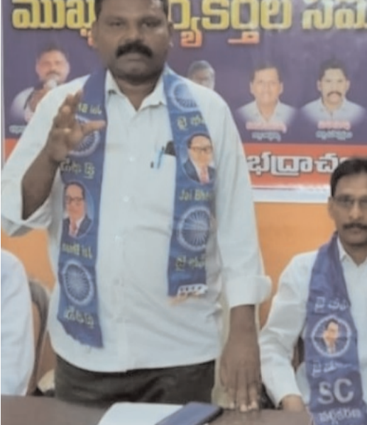
ఈనెల 15 న మాల ఉద్యోగస్తులు ఆత్మీయ సమ్మేళన జయప్రదం చేయండి.