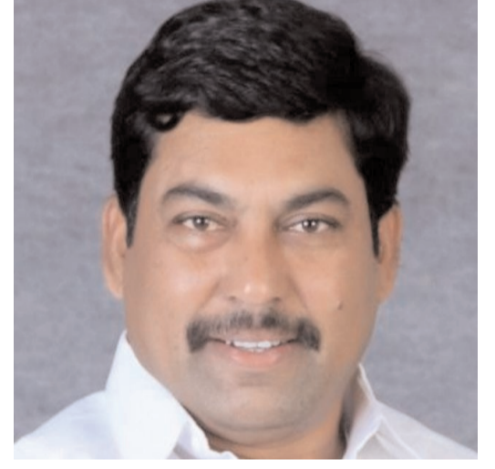
సి 3 స్టూన్ ప్రతినిధి

వికారాబాద్ జిల్లా కొడంగల్ నియోజకవర్గ పరిధిలోని దుద్దాల మండలం లగడపల్లె, రోటీ బండ తండా, పులిచెద్దకుంట తండా, గడ్డమిడి తండా, మైసమ్మ గడ్డ తండా, ఈరుల కుంట తండా, హాకింపేట, పోలేపల్లి, ఈరులపల్లి తదితర గ్రామాల రైతుల భూములను ఫార్మా కంపెనీల పేరుతో లాక్సోదాన్ని జరిగిన ప్రజాభిప్రాయ సేకరణలో జిల్లా కలెక్టర్, జాయింట్ కలెక్టర్, కాద అధికారి, స్థానిక తహసిల్దార్ లతో జరిగిన సమావేశంలో అధికారులపై జరిగిన దాడి పట్ల లంబాడి హక్కుల పోరాట సమితి రాష్ట్ర కమిటీ విచారం వ్యక్తం చేస్తుంది .