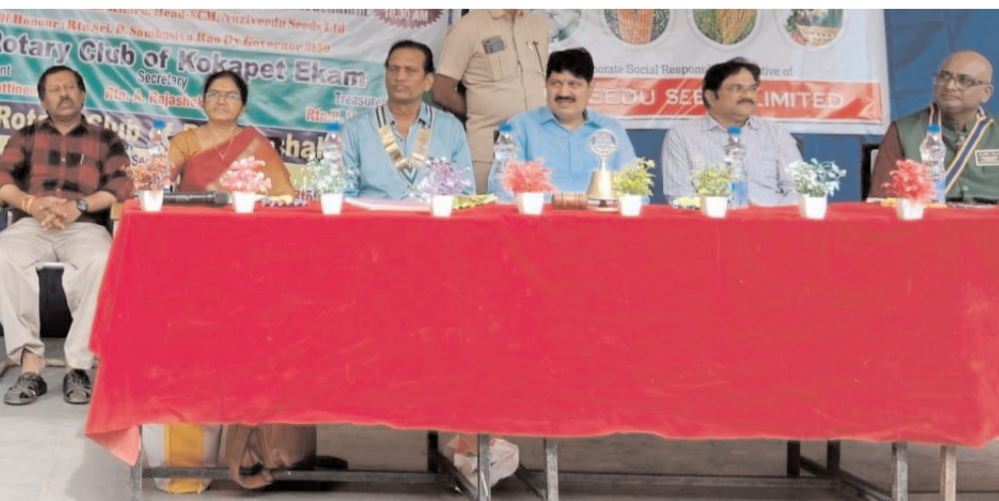
రోటరీ క్లబ్ ఆఫ్ కోకాపేట్ ఏకం, రోటరీ క్లబ్ ఆఫ్ భద్రాచలం ఆధ్వర్యంలో స్కూల్ బెంచీలు పంపిణీ.