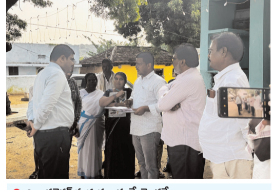
● జిల్లా కలెక్టర్ హనుమంతు కే. జెందగ్గి