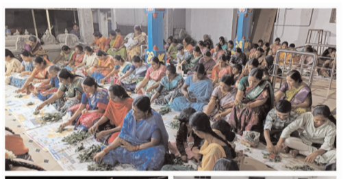
షాద్ నగర్ శ్రీ శివ మూర్తి శ్రీ వీరభద్ర (శ్రీఅయ్యప్ప స్వామి దేవాలయంలో పాల్గొన్న స్థానిక ప్రజలు