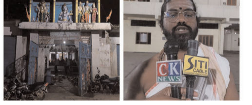
సీ కె స్యూస్ : సెప్టెంబర్ 2: శ్రావణమాసం ముగింపు,