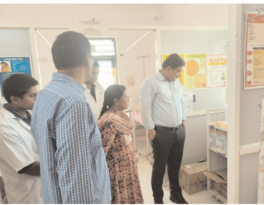
నిధారణ ప్రసవాల పట్ల ప్రోత్సాహించాలి...జిల్లా కలెక్టర్ హనుమంత్ కే.జెండగే