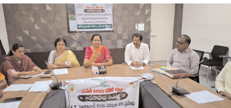
ఖమ్మం, ఆగస్ట్ 22: తెలంగాణ రాష్ట్ర ప్రభుత్వ కృషితో సిద్ధించిన టెక్నాలజీ నందు ప్రవేశాల కోసం కలెక్టరేట్ వీడియో కాన్ఫరెన్స్ హాల్లో