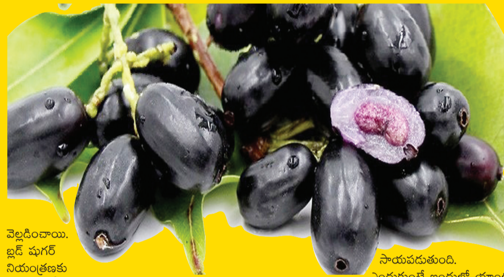
వెల్లడించాయి. బ్లడ్ సుగర్ నియంత్రణకు ఇన్సులిన్ కీలకంగా పనిచేస్తుంది. జామూన్ లోని బయో యాక్టివ్ కాంపౌండ్లు.. మధుమేహం కారణంగా తలెత్తే డయాబెటిక్ నెఫ్రోపతి, డయాబెటిక్ రెటీనోపతి, న్యూరోపతి సమస్యలు నియంత్రించే సాయపడతాయి. నేరేడు పండ్లలో జీర్ణప్రక్రియ సామర్థ్యాలు పెంచే గుణాలు ఉన్నాయి. కనుక జీర్ణ సంబంధ సమస్యలు ఉన్న వారు దీన్ని తినాలి. వ్యాధి నిరోధక శక్తిని పెంచడంలోనూ జామూన్

పర్షియాలో విరివిగా, చౌకగా లభించే పండ్లలో నేరేడు పండు ఒకటి. దీన్నే జామూన్ అని కూడా అంటారు. నల్లగా, నిగనిగలాడుతూ కనిపించే ఇవి రుచిలో అద్భుతంగా ఉంటాయి. రుచిలోనే కాదు పోషకాలు కూడా మెండుగా ఉంటాయి. ఏటా కనీసం ఓ రెండు నేరేడు పండ్లు అయినా తినితీసి, దీనివల్ల కాలేయ శుద్ధి జరుగుతుందని పెద్దలు కూడా చెబుతుంటారు. అసలు నేరేడు పండ్లలో ప్రయోజనాలు గురించి తెలిస్తే వాటిని తినకుండా ఉండలేరు. ఈ పండ్లలో గైసిమిక్ ఇండెక్స్ తక్కువ. కనుక మధుమేహులతోపాటు అందరూ హ్యాపీగా తినేయవచ్చు. ఇవి మధురంగానే ఉన్నప్పటికీ రక్తంలోకి చక్కెరలు వెంటనే విడుదల కావు. నిదానంగా విడుదల అవుడడం వల్ల బ్లడ్ సుగర్ పెరగదు. జామూన్ లో ఉండే జాంబోలిన్, ఎల్కాజిక్ యూనిడ్ ఇన్సులిన్ సెన్సిటివీని పెంచి బ్లడ్ సుగర్ ను నియంత్రిస్తాయి. బైస్ 1తోపాటు, బైస్ 2 దయాబెటిస్ కంట్రోల్ చేయడానికి ఇది మంచి పండు. జామూన్ లో యాంటీ ఆక్సిడెంట్లు అయిన యాంథోసియానిన్స్ ఉంటాయి. ఫ్రీరాడికల్స్ ను తొలగించడంలో ఇది సాయపడుతుంది. ఆక్సిడెటెడ్ డ్రైస్, ఇన్ ఫ్లమ్మేషన్ ను తగ్గిస్తుంది. జామూన్ పాంక్రియాస్ ను స్టిమ్యులేట్ చేసి మరింత ఇన్సులిన్ ను ఉత్పత్తి చేస్తుందని కొన్ని అధ్యయనాలు