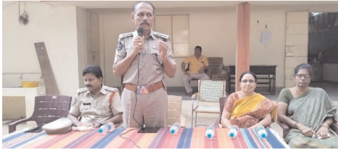
వీలైనంతవరకు సెల్ ఫోన్ వాడకుండా తగ్గించాలని, సెల్ ఫోన్ వల్ల విద్యార్థులు ఏకాగ్రత శక్తి తగ్గిపోతుంది అని, సెల్ ఫోన్లను మనకు అవసరమైన దాంతోపాటు, అవసరమైనవి ఎక్కువ వస్తుంటాయని, దానివల్ల మన ఏకాగ్రత దెబ్బతింటుందని ఆయన తెలియజేశారు. ఏకాగ్రత పెరగడానికి ధ్యానం ఒకటి మార్గమని, ధ్యానం ద్వారా ఏకాగ్రత సాధ్యమవుతుందని ఈ సందర్భంగా పిల్లలను మోటివేట్ చేశారు.

డిఎస్సీ మాట్లాడుతూ... విద్యార్థులు తీవ్రమైన ప్రశ్నలు అడిగినప్పుడు మాత్రమే, సందేహానివృత్తి ఉంటుందని, అలా కాకుండా, డౌట్ అడిగినప్పుడు ఏమనుకుంటారో ఏమో అని సైలెంట్ గా ఉండకూడదని, మరియు మన జీవిత లక్ష్యం దాకారు,తీవ్రమైన కాలాని ఉంటుందని, ప్రతి విద్యార్థి తన లక్ష్యాన్ని విద్యార్థి చదువుకునే రూమ్ లో గోడ పైన రాసి పెట్టుకోవాలని, ప్రతిరోజూ, మనం మన లక్ష్యాన్ని చూసినప్పుడు, కచ్చితంగా ఆ లక్ష్యం వైపు అడుగులు వేయడానికి అవకాశం ఉంటుందని, ఉండాలని, పట్టుదలతో చదవాలని, ఈ సందర్భంగా డిఎస్సీ తెలియజేశారు.