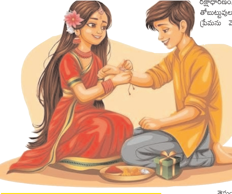
ఆత్మీయతకు మారుపేరైన రాఖీ పండుగ సందర్భంగా ప్రత్యేక కథనం