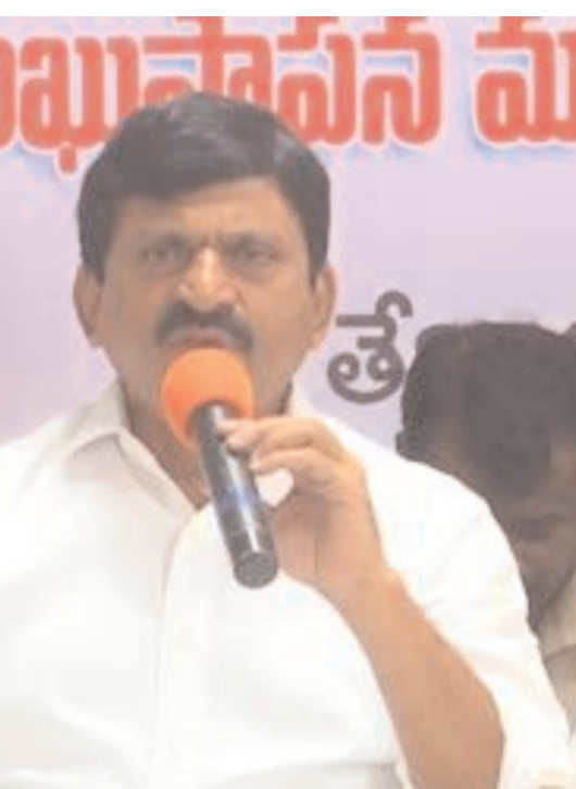
చేసినం 90% మాటల తో కాకుండా మౌలిక వసతుల విషయం లో ఈ ప్రభుత్వం సదుపాయాలు అందిస్తుంది.' అని మంత్రి పొంగులేటి శ్రీనివాస్ రెడ్డి వ్యాఖ్యానించారు..

మొక్కబడి గా పనీ చేసింది 90% వరకాల లో డ్రయిన్ సమస్యలు లేకుండా చేస్తాం 90% ప్రతి ఇంటి కి కొబ్బరి నీళ్లు ఇస్తామని చెప్పిన గత ప్రభుత్వం మిషన్ భగీరథ బాగోతం బయటపడింది అన్నారు. ప్రజలకు స్వచ్ఛమైన మంచి నీరు ఇవ్వాలని ఈ ప్రభుత్వం నిర్ణయం.. మాటల తో కాకుండా,ధనిక రాష్ట్రం అని కాకుండా, ఆభివృద్ధి, సంక్షే మాన్ని రృష్టిలో ఉంచుకుని పని చేస్తున్నాం 90% ప్రజలు కిచ్చిన రూపాయి నుంచి 2 లక్షలు వరకు రుణ మాఫీ చేసినం.. ఇప్పటి వరకు 19 వేల కోట్లు రైతుల ఖాతా లో జమ అయ్యింది 90% ప్రధాన ప్రతి పక్షంగా ఉన్న నాయకులు కొంత మంది నీ రెప్పగారు తున్నరు.. రానున్న రోజుల్లో అర్జులైన రైతులకు 12 వేల కోట్ల అందిస్తాం 90% ఇది ఇందిరమ్మ రాజ్యం 90% ఎన్నికల ముందు జాబ్ క్యాలెండరు మాట ఇప్పి నెరవేర్చుకున్నం,అసెంబ్లీ లో విడుదల