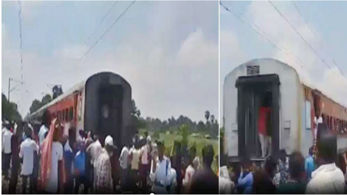
నిలిపివేయడంతో పెద్ద ప్రమాదం తప్పింది ఈ ప్రమాదంలో సమాచారం అందించడంతో.. రైల్వే ఉన్నతాధికారులు ఘటనా ఎలాంటి ప్రాణ, ఆస్తి నష్టం జరిగలేదని రైల్వే అధికారులు స్థలానికి చేరుకుని రైలు కోచ్ ను కనెక్ట్ చేశారు. అనంతరం రైలు డిల్లీకి బయలుదేరింది రైల్వే ఉన్నతాధికారులు తెలిపారు.

బీహార్ లో రైలు ప్రమాదం చోటు చేసుకుంది. సంపర్క్ క్రాంతి ఎక్స్ ప్రెస్ రైలుకు భారీ ముప్పు తప్పింది. సమస్తిపూర్ వద్ద ఈ రైలు ఇంజన్, రెండు బోగీల నుంచి ఇతర బోగీలు విడిపోయాయి. ఈ ఘటనలో ఎవరికీ గాయాలు కాలేదు. ఘటనపై నిపుణుల బృందం దర్యాప్తును ప్రారంభించింది. సంపర్క్ క్రాంతి ఎక్స్ ప్రెస్ రైలు దర్భంగ నుంచి న్యూఢిల్లీకి వెళుతుండగా సమస్తిపూర్ లో ఈ ప్రమాదం జరిగింది. ప్రమాద సమయంలో రైలు తక్కువ వేగంతో వెళ్తున్నట్లు అధికారులు చెప్పారు. వెంటనే అప్రమత్తమైన అధికారులు సుమారు గంట పాటు శ్రమించి విడిపోయిన బోగీలను ఇంజన్ కు కనెక్ట్ చేసినట్లు తూర్పు మధ్య రైల్వే చీఫ్ బల్దీప్ రిలేష్ షన్ ఆఫీసర్ చంద్ర తెలిపారు. ఈ ఘటనకు గల కారణాలను నిపుణుల బృందం పరిశీలిస్తున్నట్లు వెల్లడించారు.