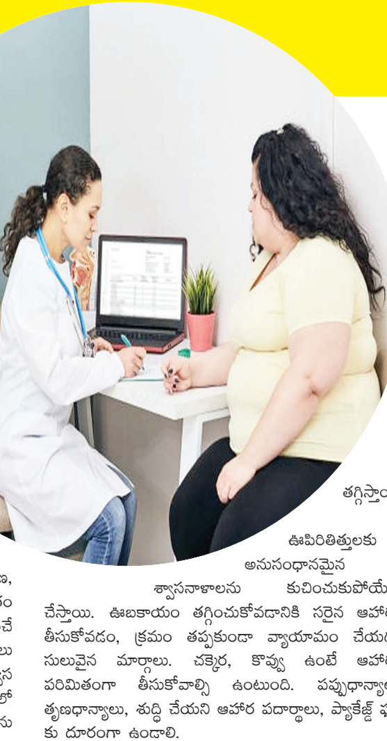
తగ్గిస్తాయి. ఊబిసీ బాధితులకు అనుసంధానమైన స్వాస్థనాలను కుచించుకోవడం చేస్తాయి. ఊబకాయం తగ్గించుకోవడానికి సరైన ఆహారం తీసుకోవడం, క్రమం తప్పకుండా వ్యాయామం చేయడం నులువైన మార్గాలు. చక్కెర, కొవ్వు ఉంటే ఆహారం పరిమితంగా తీసుకోవాల్సి ఉంటుంది. పప్పుధాన్యాలు, తృణధాన్యాలు, శుద్ధి చేయని ఆహార పదార్థాలు, ప్యాకెట్ ఫుడ్ కు దూరంగా ఉండాలి.

చుట్టూ ఉండే అదనపు కొవ్వు కారణంగా శరీరం ఇన్ ఫ్లేమేషన్ కు స్పందించే సామర్థ్యాన్ని కోల్పోతుంది. దాంతో కొవ్వులను, కార్బోహైడ్రేట్లను ప్రాసెస్ చేసే శక్తి తగ్గిపోతుంది. తద్వారా రక్తంలో చక్కెర స్థాయిలు పెరిగిపోతాయి. అంతేకాదు, అధిక బరువు, ఊబకాయం వల్ల శరీరంలోని ఎముకలు, కీళ్లపై అధిక భారం పడుతుంది. ఒబిసీ ఉన్నవారు ఆస్టియో ఆర్థరైటిస్ బారినపడే అవకాశాలు ఎక్కువ. ముఖ్యంగా, ఒబిసీ వల్ల అనేక శరీర భాగాల్లో క్యాన్సర్ కారక కణజాలం పెరుగుతుంది. ఐసోఫేగస్, పేంక్రియాస్, పెద్ద పేగు, పురీషనాళం, రొమ్ము, కిడ్నీ, గాల్ బ్లడర్, గర్భకోశ క్యాన్సర్లకు ఒబిసీతో సంబంధం ఉన్నట్లు అనేక పరిశోధనల్లో వెల్లడైంది. అటు, మహిళల్లో గర్భధారణ, ప్రసవం తదితర అంశాలను కూడా ఊబకాయం ప్రభావితం చేస్తుంది. గర్భం నిలవకపోవడం, గర్భవతుల్లో కనిపించే మధుమేహం, ప్రీఎక్లాంప్సియా వంటి దుష్ఫలితాలు కలుగుతాయి. అధికబరువు, ఒబిసీ బాధితులు స్వాస్థ సంబంధ సమస్యలతోనూ బాధపడుతుంటారు. వీరిలో పేరుకుపోయిన కొవ్వులు హృదయ కుచరం నరళతను