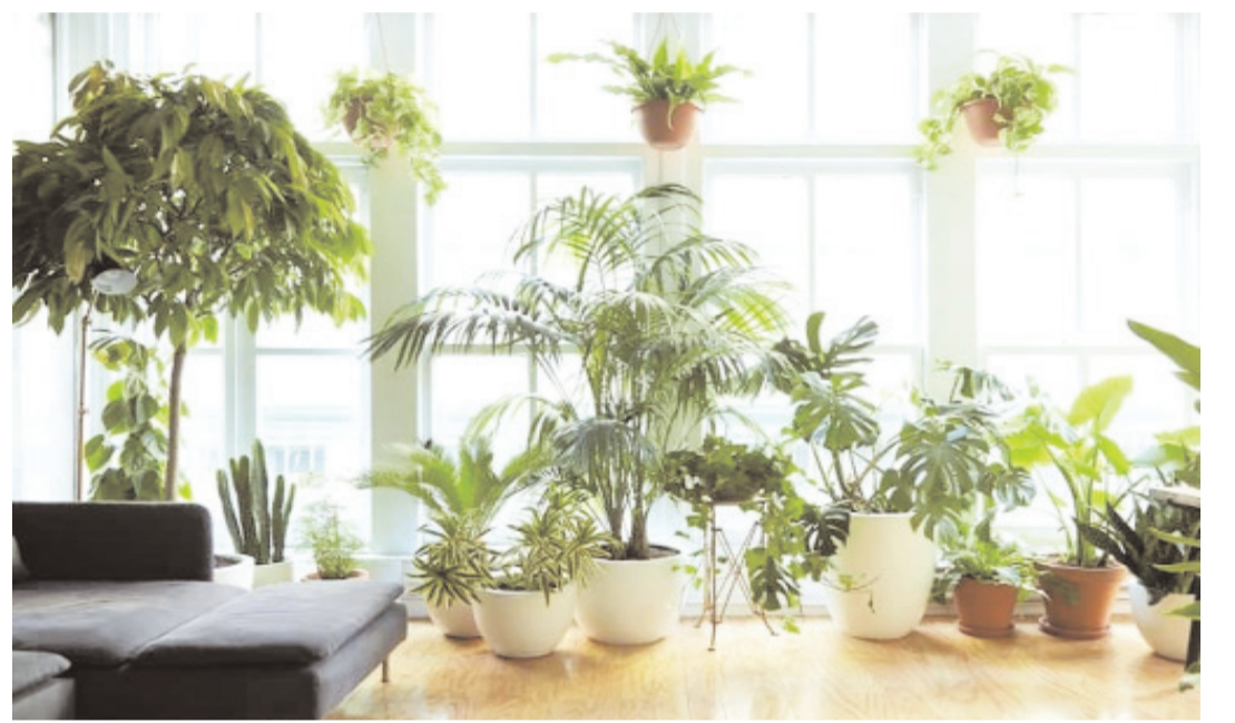
తగ్గుతుంది. ఆందోళన కూడా ఉపశమిస్తుంది. ఎందుకంటే మొక్కల నుంచి స్వచ్ఛమైన ఆక్సిజన్ విడుదల అవుతుంది. అది మనకుకు ఉల్లాసాన్నిస్తుంది. మొక్కలు చుట్టూ ఉంటే మరింత సమర్థవంతంగా పనిచేస్తారని, జ్ఞాపకశక్తికి చురుగ్గా మారుతుందని అధ్యయనాలు చెబుతున్నాయి. మెదడుపై మొక్కలు చూపించే సానుకూల ఫలితాలే దీనికి కారణం.

కొందరు ఇంట్లో కొంచెం ఖాళీ స్థలం ఉన్నా దాన్ని మొక్కలతో నింపేస్తారు. పూల కుండీల్లో తమకు నచ్చిన మొక్కలను పెంచుకుంటూ, ప్రాణంగా చూసుకుంటారు. మొక్కలపై, పర్యావరణంపై ప్రేమతోనే అనుకోకండి. మొక్కలను పెంచడం వల్ల అదనంగా మనకూ ఎన్నో ఆరోగ్య ప్రయోజనాలు ఉన్నాయి. ఈ మధ్య సోషల్ మీడియాలో ఒక అంశం తెగ ట్రెండింగ్ అయింది. కూలర్ లో నీళ్లు పోస్తున్న పోటోను పెట్టి.. 'మొక్కలకు నీళ్లు పోస్తే ఈ అవస్థ తప్పేదిగా' అంటూ క్యాప్షన్ పెట్టారు. ఇది చాలా మందిని ఆలోచింపజేసింది. ఇందులో నిజంగా ఎంతో అర్థం ఉండడంతో తెగ షేర్ కూడా అయింది. అప్పుడు నిజమే, ప్రతి ఒక్కరూ మొక్కలు నాటి, వాటికి నీళ్లు పోసి, అవి చెట్లుగా మారితే బతికి ఉన్నంత కాలం అవి మనకు నీడను ఇవ్వడమే కాదు. ఎంతో కాలాన్ని తగ్గిస్తాయి. వేడి నుంచి ఉపశమనాన్ని, పర్యావరణ కాలుష్యం నుంచి రక్షణనిచ్చే చెట్లకు ప్రాధాన్యం ఇవ్వడం చాలా అవసరం.