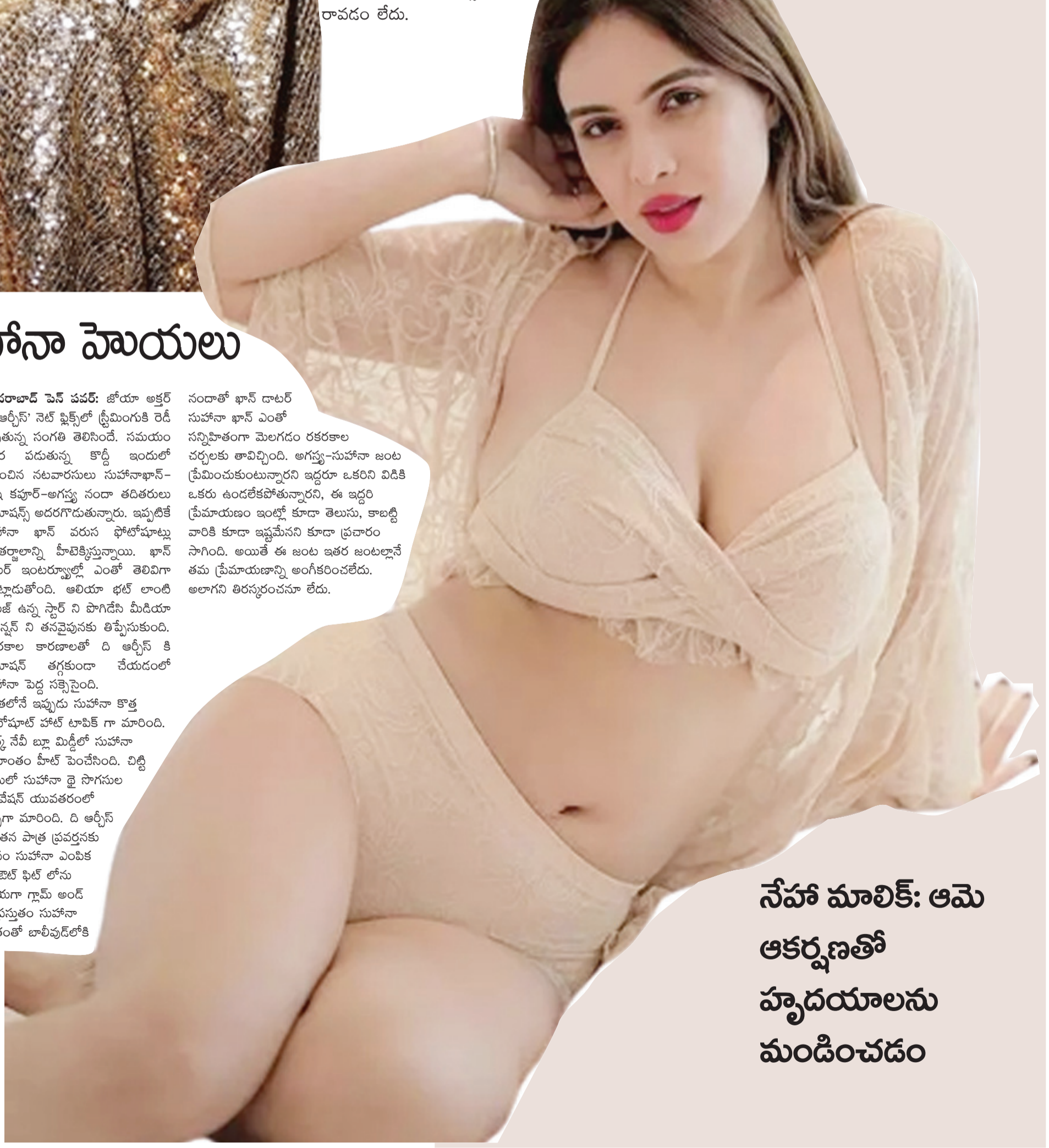
నేహా మాలిక్: ఆమె ఆకర్షణతో హృదయాలను మండించడం

నందాతో ఖాన్ డాటర్ సుహానా ఖాన్ ఎంతో సన్నిహితంగా మెలగడం రకరకాల చర్చలకు తావిచ్చింది. అగస్త్య-సుహానా జంట ప్రేమించుకుంటున్నారని ఇద్దరూ ఒకరిని విడిచి ఒకరు ఉండలేకపోతున్నారని, ఈ ఇద్దరూ ప్రేమాయణం ఇంట్లో కూడా తెలుసు, కాబట్టి వారికి కూడా ఇష్టమేనని కూడా ప్రచారం సాగింది. అయితే ఈ జంట ఇతర జంటల్లానే తమ ప్రేమాయణాన్ని అంగీకరించలేదు. అలాగని తిరస్కరంచనూ లేదు. నందాతో ఖాన్ డాటర్ సుహానా ఖాన్ ఎంతో సన్నిహితంగా మెలగడం రకరకాల చర్చలకు తావిచ్చింది. అగస్త్య-సుహానా జంట ప్రేమించుకుంటున్నారని ఇద్దరూ ఒకరిని విడిచి ఒకరు ఉండలేకపోతున్నారని, ఈ ఇద్దరూ ప్రేమాయణం ఇంట్లో కూడా తెలుసు, కాబట్టి వారికి కూడా ఇష్టమేనని కూడా ప్రచారం సాగింది. అయితే ఈ జంట ఇతర జంటల్లానే తమ ప్రేమాయణాన్ని అంగీకరించలేదు. అలాగని తిరస్కరంచనూ లేదు. ఇంతలోనే ఇప్పుడు సుహానా కొత్త ఫోటోషూట్ చోట్ టాపిక్ గా మారింది. డార్మ్ నేవీ బ్లూ మిక్డీలో సుహానా అమాంతం హీట్ పెంచేసింది. చిట్టి గౌనులో సుహానా టై సాగసుల ఎలివేషన్ యువతరంలో చర్చగా మారింది. ది ఆర్మీస్ లో తన పాత్ర ప్రవర్తనకు