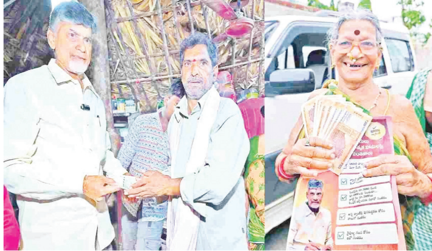
సీత స్వామి హైదరాబాద్ : పంచన చరిత్రలోనే తొలిసారి ఒకేనెల రూ.విడువేలు చేతికి అందుకున్న ఆనందం.. ఇక అందరు అనుకున్న లబ్ధి చేతికి రావడంతో ఉద్యోగం... ముఖ్యమంత్రి, మంత్రులు స్వయంగా ఇంటి గడవ తొక్కి 'ఇండా సామ్ము' అని అందిస్తుంటే పట్టణేనంత సంబరం... వెరసి రాష్ట్రమంతా పంచన పండగ మహాసంఘంభంగా సాగింది. సంక్షేమపథంలో టీడీపీ కూటమి ప్రభుత్వం తొలి అడుగులోనే సూపర్ హిట్ కొట్టింది. పంచన డబ్బులు తీసుకున్న లబ్ధిదారుల