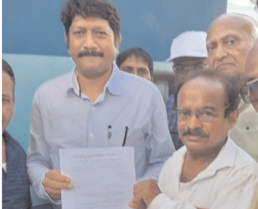
సి కే న్యూస్ ఇల్లందు నియోజకవర్గ ప్రతినిధి, జూన్ 25, గార్ల రైల్వే స్టేషన్ ఆదాయ వసతులు అనేకం ఉన్నందున రైజం