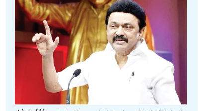
చంద్రబాబు విజయం సందర్భంగా సీఎం కేసరి రాజుగారి వద్దకు వెళ్తున్నట్లు తెలుస్తోంది.

చంద్రబాబు గారు... మీ పాలనలో ఏమీ దూసుకెళ్లాలి: తమిళనాడు సీఎం స్టాలిన్ ఏపీలో టీడీపీ ప్రభంజనం సొంతంగా 136 సానాలు కైవసం చేసుకునే దిశగా టీడీపీ చంద్రబాబుకు, టీడీపీకి శుభాకాంక్షలు తెలిపిన స్టాలిన్