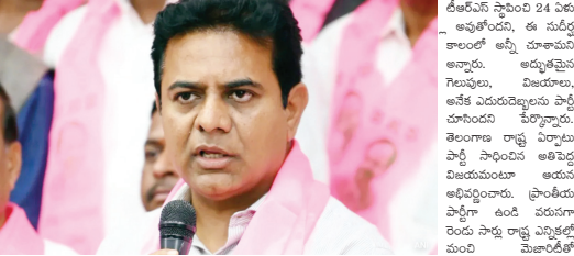
లోకసభ ఎన్నికలు-2024లో బీజేపీలో ఎన్నికల విజయం సందర్భంగా కాంగ్రెస్, బీజేపీలో కూటమి హవా పెరిగింది. కాంగ్రెస్ నేతలకు అయిదు డియ్యకం అందినట్లు తెలుస్తోంది. ఆ కేంద్రాల వద్దకు వెళ్తున్నట్లు తెలుస్తోంది.

ఈ ఎదురుదెబ్బ చాలా నిరాశకు గురిచేస్తోందన్న మాజీ మంత్రి ఓటమి ఎదురైనా కష్టపడుతూనే ఉంటామని ప్రకటన 24 ఏళ్ల సుదీర్ఘ కాలంలో అన్ని చూశామని వ్యాఖ్యానించిన బీజేపీ ఎంపీ లోకసభ ఎన్నికలు-2024లో బీజేపీలో ఎన్నికల విజయం సందర్భంగా కాంగ్రెస్, బీజేపీలో కూటమి హవా పెరిగింది. కాంగ్రెస్ నేతలకు అయిదు డియ్యకం అందినట్లు తెలుస్తోంది. ఆ కేంద్రాల వద్దకు వెళ్తున్నట్లు తెలుస్తోంది.