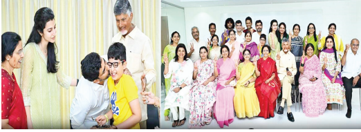
అంతర్ ప్రతిపక్ష సారాధి అయిన టీడీపీ కుటుంబ పున విజయం సందర్భంగా రాజుగారి వద్దకు వెళ్తున్నట్లు తెలుస్తోంది. ఎంపీలు, ఎమ్మెల్యేలు, ఎమ్మెసీలు, పార్టీ కార్యకర్తలు, ప్రజానాయకులు, కుటుంబ సభ్యులు, కార్యకర్తలు, నాయకులు కుటుంబ సభ్యులు కూడ ఉన్నారు. టీడీపీ 136 జనన 21 టీడీపీ 7 సిట్లతో అతిపెద్ద ప్రదర్శనలు జరుగుతున్నాయి. అధికార వైసీపీ మాత్రం పోలీసుల పర్యవేక్షనలో ఉంటుంది. 175 టీడీపీ పోలీసు వైసీపీ 12 స్థానాల్లో ఉన్న అధికార ప్రదర్శనలు, టీడీపీ ఏపీలో ప్రధాన ప్రదర్శనలు జరుగుతున్నాయి.

- మొదటి విజయం ఫలితాల నవగణన గమనించిన వెలుగుల మంత్రులు కాంగ్రెస్ కేంద్రాల నుంచి ఆధిపత్యంగా బదులీకి వచ్చినట్లు తెలుస్తోంది. టీడీపీ సంబరాలు ఎన్నికల ఫలితాల అనుకూలంగా రావడంతో టీడీపీ నాయకులు చేతులు తీసికొని, టీడీపీ కార్యకర్తలకు పుష్పలహరి, స్వీట్లు పంపడం తీవ్ర స్వాగతాల వస్తున్నాయి. ప్రధాన ప్రతిపక్ష నేతల సీటు ఫలితాల నవగణన తర్వాత వైకాపాకు ప్రతిపక్ష నేతలకు అయిదు డియ్యకం అందినట్లు తెలుస్తోంది. ఆ కేంద్రాల వద్దకు వెళ్తున్నట్లు. చంద్రబాబు విజయం చంద్రబాబు విజయం సందర్భంగా సీఎం కేసరి రాజుగారి వద్దకు వెళ్తున్నట్లు తెలుస్తోంది.