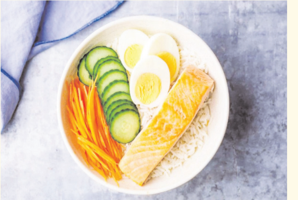
క్యారెట్లు, పాలకూర, బాదం గింజలు తీసుకోవచ్చు వీటిల్లో కంటిని కాపాడే ఇంగ్రెడియంట్లు

సర్వేంద్రియానాం నయనం ప్రధానం. మన శరీరంలో కళ్లకు ప్రాధాన్యం ఎంతో ఉంటుంది. కావాల్సిన పోషకాలు అందేలా చూసుకుంటే చాలు. కంటి చూపును జాగ్రత్తగా కాపాడుకోవచ్చు. అలాగే, కంటి నరాలపై ఒత్తిడి లేకుండా చూసుకోవాలి. మధుమేహం, బీపీ ఉన్న వారు వాటిని నియంత్రించే పెట్టుకుని, పోషకాహారం అందించడం ద్వారా కంటిచూపు దెబ్బతినకుండా చూసుకోవచ్చు. పోషకాలంటే విటమిన్ ఏ, ఒమెగా 3 ఫ్యాటీ యాసిడ్స్ అందించాలి. కంటి చూపు ఎందుకు తగ్గుతుంది? అనే దానికి వయసు పెరగడం ఒక కారణం. ఫోస్ఫో, కంప్యూటర్ స్క్రీన్లను గంటల తరబడి చూస్తుంటే కంటికి విఠాంతి తగ్గి, నష్టం జరుగుతుంది. ఇవి కాకుండా ఒత్తిడి, పోషకాల లేమితోనూ కంటి చూపు మసకబారుతుంది.