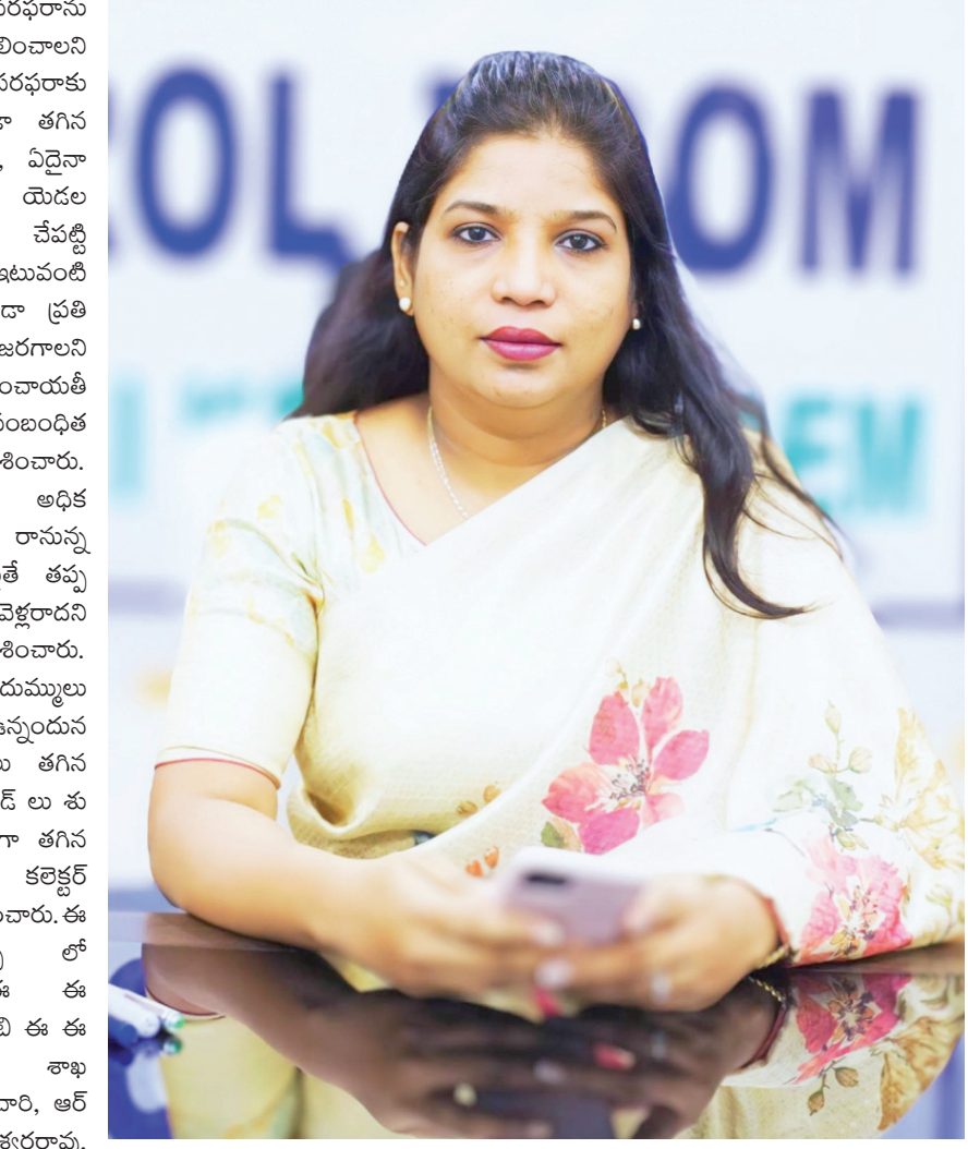
ఈ ఓ లు, డీకలు, ఏ కు లు, ఏ పి ఎం లు, వి ఓ అధ్యక్షురాలు , మండల సమాఖ్య ప్రెసిడెంట్లు, తదితరులు పాల్గొన్నారు.