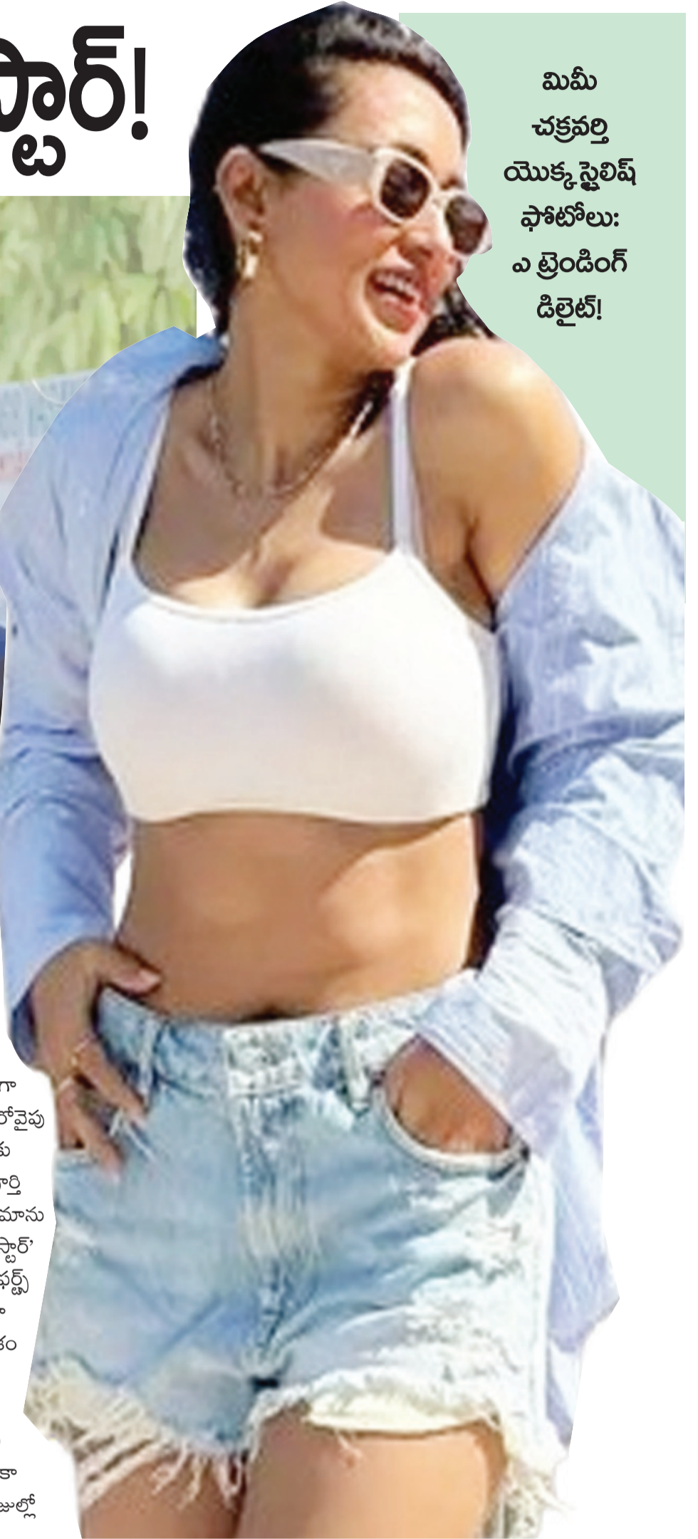
మమీ చక్రవర్తి యొక్క స్టైలిష్ ఫోటోలు: ఎ ట్రెండింగ్ డిలైట్!

గొప్పదనాన్ని చాటి చెప్పాలనుకున్న దర్శకుడు.. ఆశించిన స్థాయిలో ఆకట్టుకోలేకపోయారని ఆడియన్స్ అభిప్రాయ పడుతున్నారు. ఫస్ట్ వరకూ బాగానే ఉన్నప్పటికీ, సెకండాఫ్