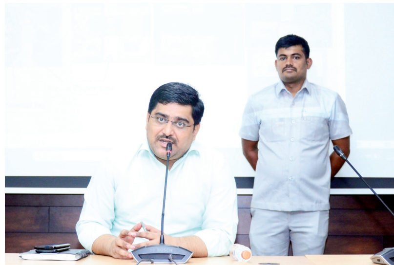
ప్రతి ఒక్కరూ తమ ఓటు హక్కును స్వేచ్ఛగా వినియోగించుకునేందుకు కావలసిన అన్ని చర్యలను తీసుకోవాలి...

జిల్లా కలెక్టరు హనుమంత్ కే.జెందగ్గి సి కే సూన్ (సంవత్) ఏప్రిల్ 16: ఎన్నికల నిబంధనలను ఖచ్చితంగా అమలు చేయాలని, ప్రతి ఒక్కరూ తమ ఓటు హక్కును స్వేచ్ఛగా వినియోగించుకునేందుకు కావలసిన అన్ని చర్యలను తీసుకోవాలని జిల్లా కలెక్టరు హనుమంత్ కే.జెందగ్గి సెక్టోరియల్ ఆఫీసర్లకు సూచించారు. మంగళవారం నాడు జిల్లా కలెక్టరు కార్యాలయ సమావేశ మందిరంలో సెక్టోరియల్ అధికారుల అవగాహన కార్యక్రమంలో ఆయన మాట్లాడుతూ... ఎన్నికల నిబంధనలను ఖచ్చితంగా అమలు చేసేందుకు క్షేత్రస్థాయిలో అన్ని చర్యలను తీసుకోవాలని, తమ పరిధిలోని రూల్ మాఫులపై అవగాహన ఉండాలని, సెక్టోరియల్ అధికారుల విధి విధానాల హ్యాండ్ బుక్ లోని నియమాలను, మార్గదర్శకాల పట్ల క్షుణ్ణంగా అవగాహన కలిగి వుండాలని సూచించారు. ప్రతి ఒక్కరూ ఓటింగ్ లో పాల్గొనేలా, ఓటింగ్ శాతం పెరిగేలా స్టీప్ ప్రచార కార్యక్రమాలలో భాగస్వామ్యం కావాలని తెలిపారు. పోలింగ్ విధానంలో రిటర్నింగ్ ఆఫీసర్ కు ప్రొసైడింగ్ ఆఫీసర్ కు మధ్య అనుసంధానకర్తగా సెక్టోరియల్ అధికారి ఉంటారని, వారి ఆధీనంలో 12 పోలింగ్ కేంద్రాల వరకు ఉంటారని, వాటిని పర్యవేక్షించాలని తెలిపారు. పోలింగ్ కేంద్రాలకు సంబంధించి వల్చర్లు మ్యాపింగ్ చేయాలని, ఎన్నికల ఓటింగ్ చేయించాలని, ఓటర్లను ప్రభావితం చేసే అవకాశాలు ఉన్న చోట తరచు సందర్శించాలని, క్రిటికల్ పోలింగ్ కేంద్రాలకు సంబంధించి బూత్ లెవల్ అధికారులతో కలిసి క్షేత్రస్థాయిలో ఓటర్లకు అవగాహన కలిగించేలా పని