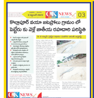
సి కే న్యూస్ ప్రత్యేక కథనం సులిగిం తయోజి

సి కే న్యూస్ ప్రతినిధి, పెండ్లపల్లి మండలం జలప్రోలు గ్రామంలోని జాతీయ రహదారి గత ఐదు నెలల నుంచి చాలా ఘోరంగా మరియు ప్రయాణీకులకు ఇబ్బందిపెట్టేలా ఉన్న పరిస్థితి అందరికీ తెలిసిన విషయమే అయితే విషయానికి వచ్చినట్లుంటే గ్రామంలోని ఉన్న