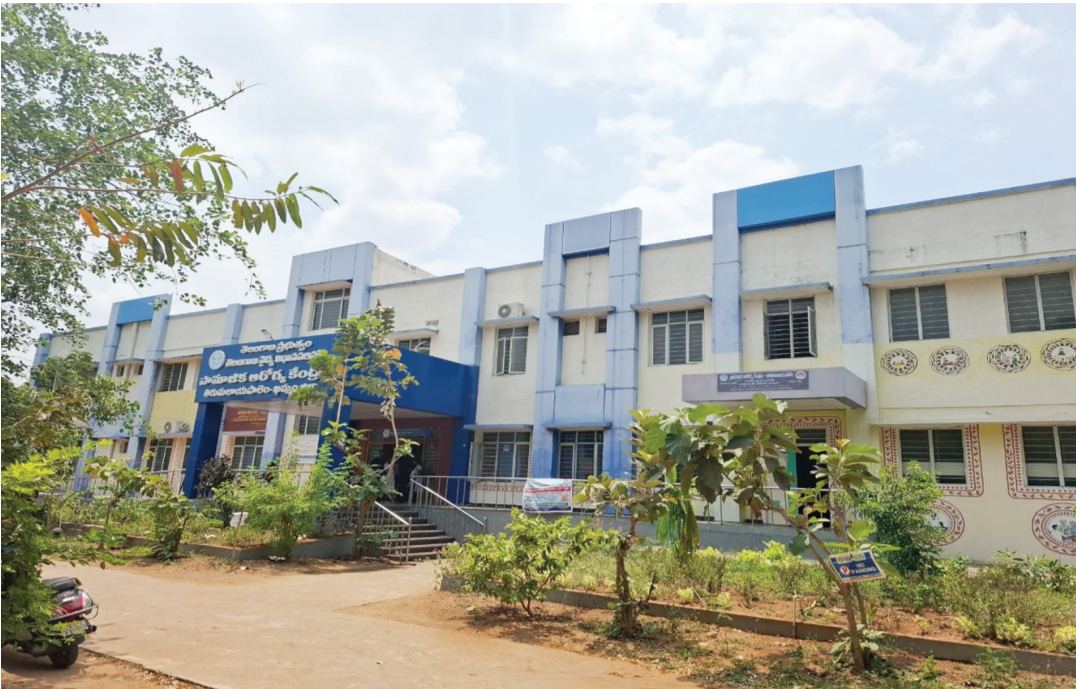
ఇలాంటి వైద్యుల పనితీరును చెక్ పెట్టాలని, ఆదేశాధిగా జిల్లా కలెక్టర్ దృష్టిసారించి ప్రజా వైద్యకాలను రౌండ్ ద క్లాక్ విభాగంలో పనిచేసే విధంగా చర్యలు చేపట్టాలని తిరుమలాయపాలెం మండల ప్రజలు కోరుకుంటున్నారు

- మొదటి పేజీ తరువాయి సైతం బేఖాతారు చేస్తూ ఖమ్మం జిల్లా తిరుమలాయపాలెం మండలంలో సామాజిక ఆరోగ్య కేంద్రంలో పనిచేస్తున్న వైద్యులను, వైద్యులు సమయపాటుననే ఇష్టానుసారంగా వ్యవహరిస్తూ.. సర్కారు జీతంతో టైమ్ పాస్ ఉద్యోగాలను నిర్వహిస్తూ.. తమ సొంత ప్రైవేట్ ఆస్పత్రుల కార్పొరేట్ వైద్య సేవలకు వైద్య మకుటతో సర్కారు సేవలకు స్టాఫ్ బ్రాకులు చేస్తూ.. తమ ప్రైవేట్ వైద్యసేవలను సై.. అంటూ... ప్రైవేట్ వైద్యులకి ఎక్కువ ఆసక్తిని చూపుతున్నారని నిరక్షప నిబద్ధతపై కొరడా రుబులించాలని తిరుమలాయపాలెం ప్రజలు మంత్రులను కోరుతున్నారు.