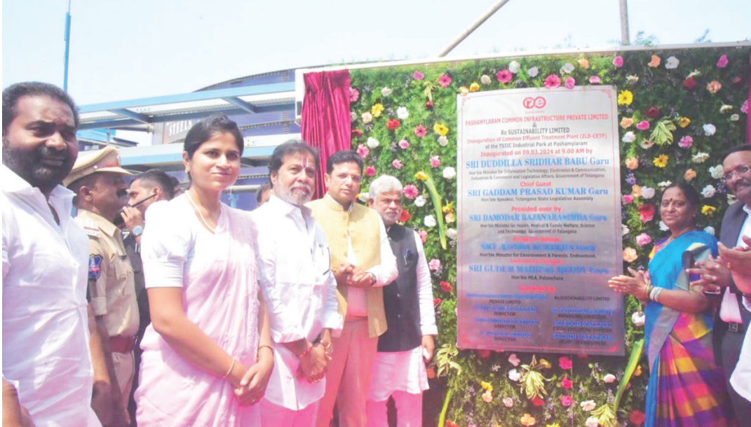
సికె స్యూస్ ప్రతినిధి పటాన్యూరు నియోజకవర్గం/సంగారెడ్డి జిల్లా పటాన్ చెరు మండలంలోని పాశమైలారం