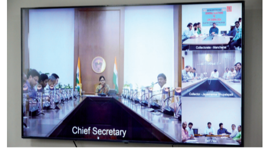
అధికారులు తెలిపారు. పనిచేయని బోరు బావులను, చేతి బోర్డును మరమ్మతులతో పునరుద్ధరించాలని, అత్యంత ప్రాధాన్యతతో త్రాగునీటి సరఫరా పనులు పూర్తి చేయాలని అన్నారు. త్రాగునీటి సరఫరాలో ఎక్కడైనా ఇబ్బందులు ఎదురైతే వెంటనే ప్రత్యామ్నాయ ఏర్పాట్లు చేసేందుకు నన్నద్దం కావాలని అన్నారు. ప్రతి మున్సిపాలిటీలో చివరి వార్డ్, గ్రామాలలో చివరి ప్రాంతం వరకు త్రాగునీటి సరఫరా జరిగే విధంగా చర్యలు తీసుకోవాలని, త్రాగునీటి సరఫరాకు సంబంధించిన ప్రతి అంశాన్ని పర్యవేక్షించాలని అన్నారు. క్షేత్రస్థాయిలో మున్సిపల్ ఇంజనీర్లు, ఆర్. డబ్ల్యూ. ఎస్. ఇంజనీర్లు సమన్వయంతో త్రాగునీటి సకల సరఫరా చేయాలని, నీటి లభ్యత, సరఫరాల పట్ల పూర్తి అవగాహన కలిగివుండాలని, సమస్యలు ఏర్పడే ప్రాంతాలను గుర్తించాలని, అవసరమైన చోట ట్యాంకర్ల ద్వారా మంచినీటి సరఫరాకు అన్ని ఏర్పాట్లు చేసుకోవాలని, గ్రామ, మండల స్థాయి అధికారుల క్షేత్రస్థాయి పర్యవేక్షణతో త్రాగునీటి సమస్యను అధిగమించాలని సూచించారు. జిల్లా కలెక్టరు హనుమంతు కే. కేంద్రం వివరిస్తూ... జిల్లాలో 4 లక్షల మెట్రిక్ టన్నుల ధాన్యం రానున్నదని, 323 కొనుగోలు కేంద్రాల ద్వారా కొనుగోళ్లు నిర్వహిస్తామని తెలిపారు. జిల్లాలో 720 ఆవాసాలు ఉన్నాయని, అర్బన్, గ్రామాలలో పనిచేయని బోర్డును గుర్తించి మరమ్మత్తు పనులు చేపట్టడం జరిగిందని, త్రాగునీటి సరఫరాలో ఇబ్బందులు ఏర్పడకుండా ఆర్. డబ్ల్యూ. ఎస్. అధికారులు, మున్సిపల్ కమిషనర్లతో పర్యవేక్షిస్తున్నామని, పూర్తి కార్యాచరణ ప్రణాళికతో సమన్వయంకోసం జరుగుతున్నట్లు తెలిపారు. కార్యక్రమంలో జిల్లా రెవిన్యూ అదనపు కలెక్టర్ పి. బి.ఎస్. షాహామ్, జిల్లా స్థానిక సంస్థల అదనపు కలెక్టరు గంగాధర్, జిల్లా సరఫరాల అధికారి శ్రీనివాసరెడ్డి, సివిల్ సప్లయ్ డివిజన్ గోపీకృష్ణ, జిల్లా వ్యవసాయ అధికారి అమరాధ, మిషన్ భగీరథ డి.కే. కరుణాకర్ మున్సిపల్ కమిషనర్లు, తదితరులు పాల్గొన్నారు.