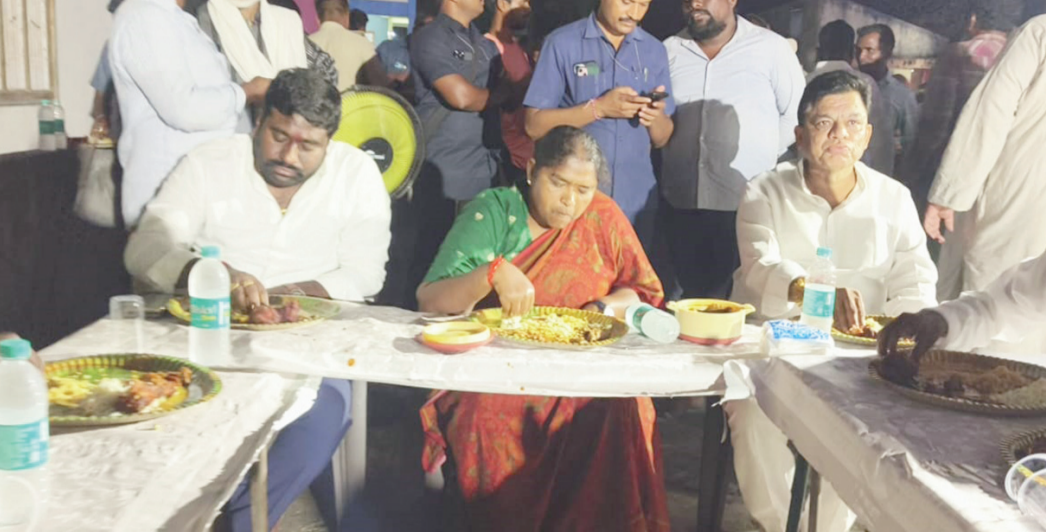
పాలు కాంగ్రెస్ పార్టీ రాష్ట్ర జిల్లా ఖాక్ మండల అధ్యక్షులు గ్రామ,మండల జిల్లా నాయకులు, కార్యకర్తలు తదితరులు అనుబంధ సంఘాల అధ్యక్షులు ప్రజా ప్రతినిధులు పాల్గొన్నారు...