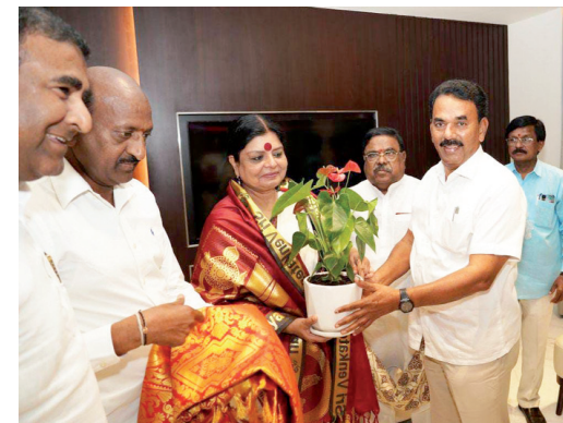
సీకే న్యూస్ ప్రతినిధి, కొల్లాపూర్, తెలంగాణ రాష్ట్ర కాంగ్రెస్

● రాష్ట్ర అబ్జర్వర్, పర్యాటక, సాంస్కృతిక, పురావస్తు శాఖ మంత్రి జూపల్లి కృష్ణారావు