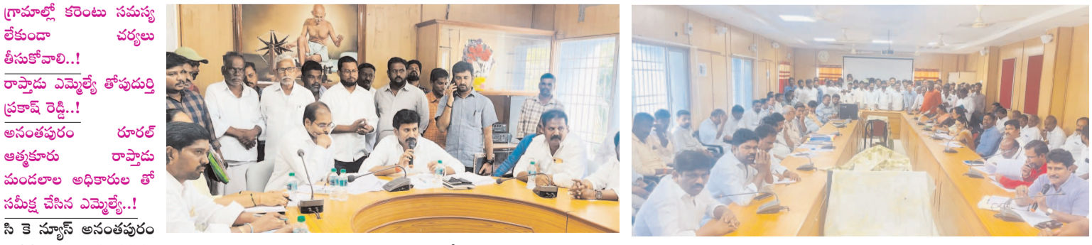
గ్రామాల్లో కరెంటు సమస్య లేకుండా చర్యలు తీసుకోవాలి..! రాష్ట్రాదు ఎమ్మెల్యే తోపూర్తి ప్రకాష్ రెడ్డి..! అనంతపురం రూరల్ అభ్యుక్త రాష్ట్రాదు మండలాల అధికారుల తో సమీక్ష చేసిన ఎమ్మెల్యే..!

కార్యక్రమంలో తన దృష్టికి వచ్చిన సమస్యల పరిష్కారానికి గతంలోనే సంబంధిత అధికారులకు ఆదేశించారు. సచివాలయాల్లో వారిని ఆ సమస్యలు ఏ మేరకు పరిష్కారమయ్యాయి అడిగి తెలుసుకున్నారు. పట్టాల విషయంలో ఏమాత్రం అలసత్వం చేయొద్దని, ఎక్కడైనా సమస్య ఉంటే తన దృష్టికి తీసుకువస్తే ఉన్నతాధికారుల తో మాట్లాడి పరిష్కరించేలా చర్యలు తీసుకుంటా. గ్రామాల్లో ఎట్టి పరిస్థితుల్లోనూ కరెంటు సమస్యలు ఉండకూడదు. అవసరమైన ప్రాంతాల్లో ట్రాన్స్మిషన్ లైన్లు ఏర్పాటు చేయండి. పొల్లు పిసింగ్ విషయంలోనూ వెంటనే చర్యలు తీసుకోవాలని ఆదేశించారు