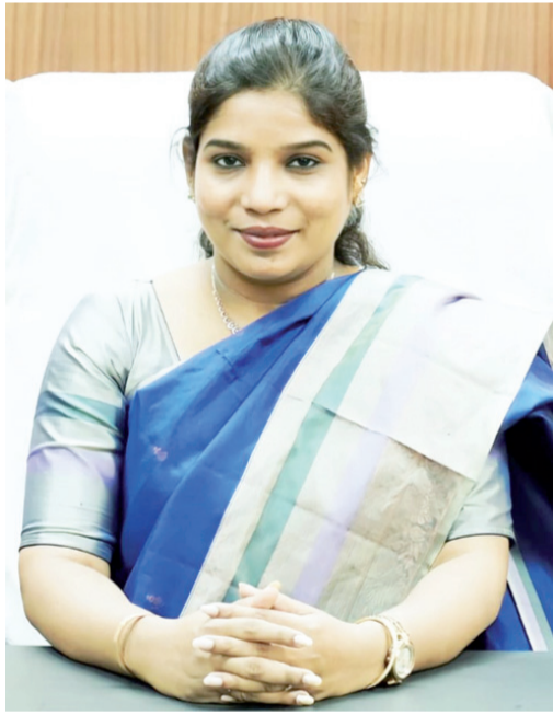
అక్షేపణలు, పలన వెళ్లిన, మరణించిన వారి వివరాలు తెలపడానికి ఫారం-7 లో వివరాలు అంద చేయాలని కలెక్టర్ పేర్కొన్నారు.