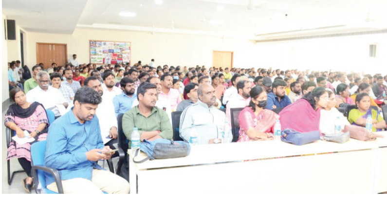
జిల్లా కలెక్టర్ మానుమంతు కే.జెందగ్

సి కే సూన్స్ యాదాద్రి భువనగిరి జిల్లా ప్రతినిధి (సంపత్) జనవరి 05: ప్రజాపాలనలో స్వీకరించిన దరఖాస్తుల ఆన్లైన్ నమోదు ప్రక్రియ జాగ్రత్తగా నిర్వహించాలని జిల్లా కలెక్టరు మానుమంతు కే.జెందగ్ డాటా ఎంట్రీ సిబ్బందికి సూచించారు. శుక్రవారం నాడు కలెక్టరేటు సమావేశ మందిరంలో ప్రజాపాలన దరఖాస్తులను ఆన్లైన్ నమోదు