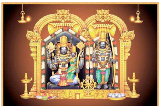
దక్షిణ అయోధ్యగా పిలిచే భద్రాద్రి పై పాలకుల నిర్ణయం ● భద్రాచలం సమస్యను రాజకీయ పోలికలు మేనిఫెస్టోలో చొరబాలి.

సీ కే న్యూస్ భద్రాద్రి కొత్తగూడెం జిల్లా ప్రతినిధి,జనవరి 19,తండ్రికి ఇచ్చిన మాట కోసం వనవాస బాట వట్టివైకుంఠ రాముడు ఈ భద్రాచలం ఏజెన్సీ ప్రాంతాలలో సంవందించారని భక్తుల ప్రధాన విశ్వాసం. అందుకే రాముడు నడియాడిన ఈ ప్రాంతం దక్షిణ అయోధ్యగా పిలుస్తారు అటువంటి భద్రాచలం పై పాలకులకు ప్రేమ ఎందుకు కలగటం లేదా అన్నది ఇప్పుడు ఈ ప్రాంత ప్రజల్లో ఉన్న ప్రశ్న. ఈనెల 22వ తారీఖున అట్టహాసంగా అయోధ్య లో జరుగుతున్న రామయ్యకు ప్రాణ ప్రతిష్ఠ జరుగుతున్న కార్యక్రమాన్ని వీక్షించాలని కేంద్ర ప్రభుత్వం దేశ ప్రజలకు పిలుపునివ్వటమే కాక అతిరథ మహాధర్మలకు ఆహ్వానించబట్టిన అందిచి హుటాహుటే ప్రాణప్రతిష్ఠ కార్యక్రమాన్ని చేపట్టిన విషయం తెలిసిందే. అదే సందర్భంలో హిందువులు అత్యంత పవిత్రంగా చూసి జీవనది అయిన గోదావరి తీర ప్రాంతాన తానినే ప్రభాసి వ్యతిరేకించి మరీ రామయ్య పై ఉన్న భక్తితో రామదాసు నిర్మించిన భద్రాచలం రామాలయం పై మాత్రం చూపిస్తున్న వివక్షతో ఈ ప్రాంత ప్రజలు తోపాటు దేశం లో ఉన్న రామయ్య భక్తులు సైతం అనంతసూరి వివక్షం చేస్తున్న విషయం పాలకులకు అర్థం