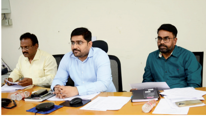
● రాష్ట్ర ప్రధాన ఎన్నికల అధికారి వికాస్ రాజ్

సి కే న్యూస్ యాదాద్రి భువనగిరి జిల్లా ప్రతినిధి (సంపత్) జనవరి 19: ప్రత్యేక ఓటరు సవరణ కార్యక్రమంలో భాగంగా అర్హత గల ప్రతి ఒక్కరికీ ఓటు హక్కు కల్పించాలని, 18- 19 సంవత్సరాల వయస్సు గల యువ ఓటర్లపై ప్రత్యేక దృష్టి సారించాలని రాష్ట్ర ప్రధాన ఎన్నికల అధికారి వికాస్ రాజ్ జిల్లా కలెక్టర్లకు సూచించారు. శుక్రవారం నాడు ఆయన వీడియో కాన్ఫరెన్స్ ద్వారా జిల్లా కలెక్టర్లతో (స్పెషల్ సమ్మి రివిజన్) ప్రత్యేక ఓటరు సవరణ కార్యక్రమంపై సమీక్షిస్తూ... ఈ నెల 20, 21 తేదీలలో ప్రత్యేక ఓటరు సమావేశ కార్యక్రమంలో అర్హత కలిగిన ప్రతి ఒక్కరికీ ఓటు హక్కు కల్పించేలా, ముఖ్యంగా 18 ఏళ్ళు పూర్తి చేసుకున్న యువత, యువకులందరూ తప్పనిసరిగా ఓటరు జాబితాలో పేరు సమాధి చేసుకునేలా చర్యలు తీసుకోవాలన్నారు. ప్రతి పోలింగ్ కేంద్రం వద్ద నిర్దిష్ట 6, 7, 8 దరఖాస్తు ఫార్మాలతో బాట్ లెవెల్ అధికారులు అందజేయాలి. ఓటరు ముసాయిదా జాబితాలో ఏమైనా మార్పులు, చేర్పులు, సవరణలు, తొలగింపులు చేపట్టాల్సి ఉన్నట్లయితే, వాటిని సరిచేసుకునేలా