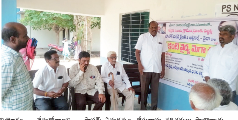
సద్వీరయోగం చేసుకోవాలని పాస్టర్స్ ఏనుగుత్తం, జేసుదాసు తదితరులు పాల్గొన్నారు.