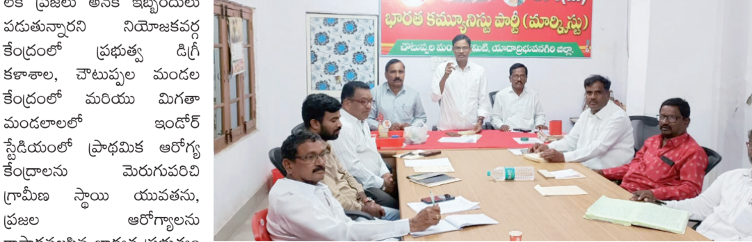
లేక ప్రజలు అనేక ఇబ్బందులు పడుతున్నారని నియోజకవర్గ కేంద్రంలో ప్రభుత్వ డిగ్రీ కళాశాల, చౌటుప్పల్ మండల కేంద్రంలో మరియు మిగతా మండలాలలో ఇండోర్ స్టేడియంలో ప్రాథమిక ఆరోగ్య కేంద్రాలను మెరుగుపరిచి గ్రామీణ స్థాయి యువతను, ప్రజల ఆరోగ్యాలను కాపాడవలసిన బాధ్యత ప్రభుత్వం మీద ఉందని వారు గుర్తు చేశారు. గత ప్రభుత్వం ప్రజా సమస్యలు వివరానికి కూడా సమయం ఇచ్చిన పరిస్థితి లేదని ప్రస్తుత ప్రభుత్వం ప్రజా సమస్యల కోసం ప్రత్యేకమైన సమయం కేటాయించడం సిపిఎం పార్టీగా ఆహ్వానించ దగ్గ విషయమని వారు అన్నారు. ఈ సందర్భంలో మునుగోడు నియోజకవర్గ వ్యాప్తంగా ఉన్న సమస్యల పరిష్కారం కోసం మునుగోడు నియోజకవర్గ అభివృద్ధి కోసం స్థానిక