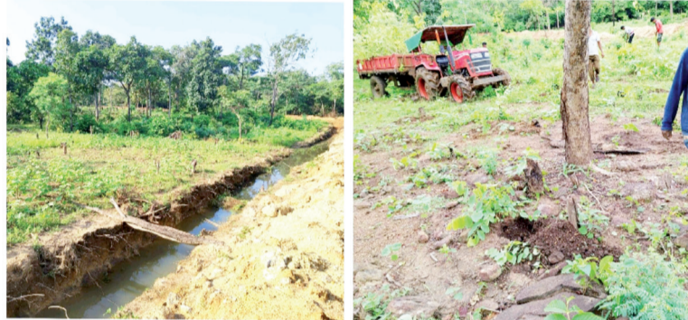
చేసు మధ్యలో త్రవ్విన కందకం మరియు బలవంతంగా జామాయిల్ నాటిస్తున్న దృశ్యం

తెల్ల కాగితాలపై సంతకాలు చేయాలని వేధిస్తున్నారు:- బాధిత రైతులు ఒకవైపు తెలంగాణ రాష్ట్ర ఉన్నత న్యాయస్థానంలో కేసు నడుస్తున్నా ఆధారాలేవీ అటవీ శాఖ అధికారులు మాత్రం గిరిజనులను వేధించడం మానడంలేదు. బాధిత రైతులను పిలిపించి పట్టా పుస్తకాలు ఇస్తుందని, తెల్ల కాగితాల్లో సంతకాలు చేయాలని బెదిరిస్తున్నారు. అసలు తెల్ల కాగితాలపై ఎందుకు సంతకాలు చేయాలనే రైతుల ప్రశ్నకు అటవీ శాఖ అధికారులు సమాధానం చెప్పలేదు. గ్రామ స్థాయి అటవీ హక్కుల కమిటీ సభ్యులను కూడా అధికారులు తమ చెప్పుచేతలో పెట్టుకున్నారు. పోడు రైతులకు అండగా నిలవాల్సిన గ్రామ కమిటీ సభ్యులు అటవీ శాఖ అధికారుల చేతిలో కీలు బొమ్మలుగా మారి సాటి రైతులపై ఆగ్రహం వ్యక్తం చేస్తూ ఖాళీ తెల్ల కాగితాలపై సంతకాలు చేయాలని ఒత్తిడి చేయడం గమనార్హం. కోర్టుకు వెళ్లిన రైతులపై వేధింపులు ఎలా ఉన్నాయంటే డిఎఫ్.ఓ., డిఆర్.ఓ., ఎఫ్.ఆర్.ఓ., సెక్షన్ ఆఫీసర్ ఓట్ ఆఫీసర్లతో పాటు స్థానిక గ్రామ సర్పంచి