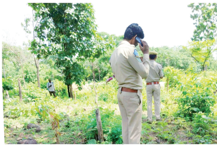
పట్టాలు ఇచ్చిన భూముల్లో ఫార్మేట్ అధికారులు

న్యాయానిందింది. అటవీ శాఖ అధికారుల వేధింపులు భరించలేక నిరుపేద గిరిజన రైతులు కోర్టు ఖర్చులు భరించి హైకోర్టు దాకా వచ్చారని... అధికారులు ఇబ్బంది పెట్టకుండానే రైతులు హైకోర్టుదాకా వచ్చారా అంటూ ప్రభుత్వ న్యాయవాదిని ప్రశ్నించింది. ఇకపై గిరిజనులకు పట్టాలు ఇచ్చిన వ్యవసాయ భూముల్లోకి అధికారులెవరూ అడుగు పెట్టొద్దని ప్రాథమిక ఉత్తర్వులిచ్చింది. తదుపరి ఈ కేసును వచ్చే వారానికి వాయిదా వేసింది.