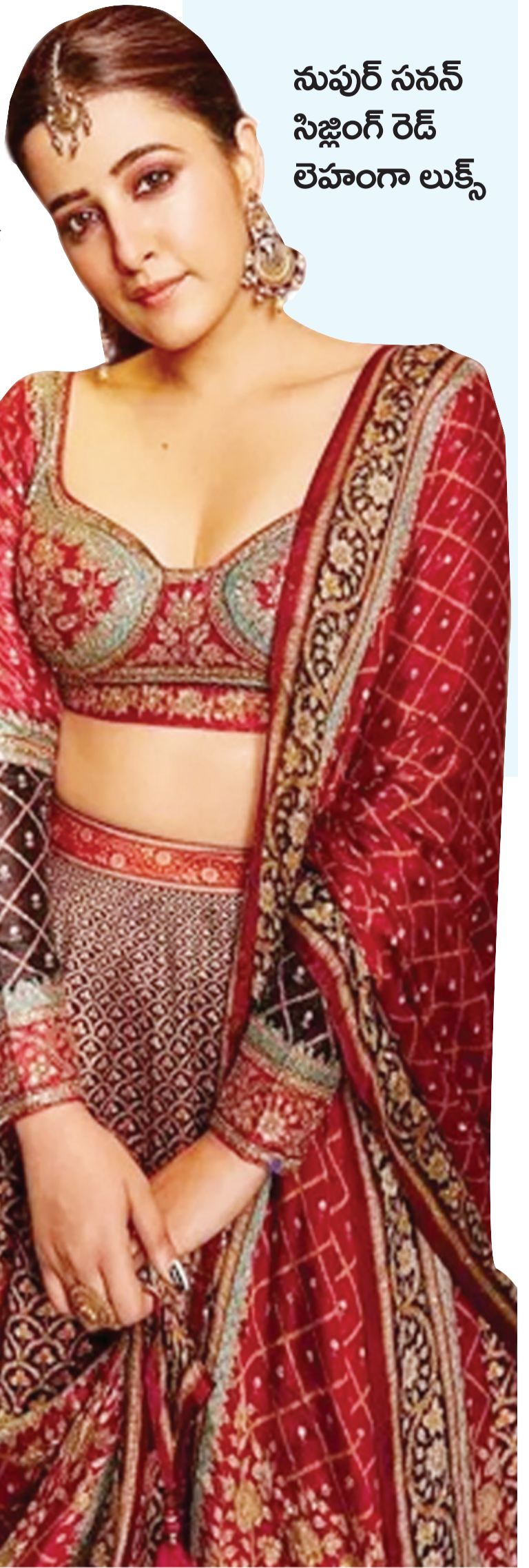
నుపుర్ సనన్ సిజింగ్ రెడ్ లెహంగా లుక్స్