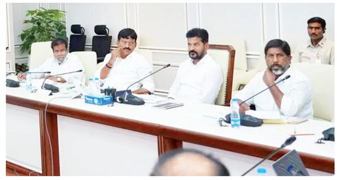
చర్చించినట్లు సమాచారం. అనంతరం గవర్నర్ ప్రసంగాన్ని ఆమోదిస్తూ కేబినెట్ తీర్మానం చేసింది..

సీ కే న్యూస్ ప్రతినిధి, హైదరాబాద్: తెలంగాణ కేబినెట్ భేటీ ముగిసింది. రాష్ట్ర ముఖ్యమంత్రి రేవంత్ రెడ్డి అధ్యక్షతన జరిగిన మంత్రివర్గ సమావేశంలో గవర్నర్ ప్రసంగానికి ఆమోదం లభించింది.. శుక్రవారం ఉభయ సభలను ఉద్దేశించి గవర్నర్ తమిళిసై సౌందరరాజన్ (Tamilisai Soundararajan) ప్రసంగించనున్నారు. గవర్నర్ ప్రసంగంలో ఉంచాల్సిన అంశాలపై కేబినెట్ భేటీలో చర్చించారు. కాంగ్రెస్ ప్రభుత్వం ఏర్పాటైన తర్వాత తొలి ప్రసంగం కావడంతో ప్రజలకు ఎలాంటి సందేహం ఇవ్వాలనే దానిపై సుమారు గంటన్నరపాటు చర్చ జరిగింది.. ప్రస్తుతం తెలంగాణ రాష్ట్రం ఎలాంటి పరిస్థితిలో ఉంది.. రానున్న రోజుల్లో ఎలా ఉండబోతుందనే అంశాలతో గవర్నర్ ప్రసంగం ఉండనున్నట్లు తెలుస్తోంది. ఎన్నికల హామీల్లో భాగంగా ప్రకటించిన ఆరు గ్యారంటీల్లో ఇప్పటికే రెండింటిని ప్రభుత్వం మొదలుపెట్టిన విషయం తెలిసిందే. మిగతా నాలుగు గ్యారంటీల అమలుపై మంత్రివర్గ సమావేశంలో